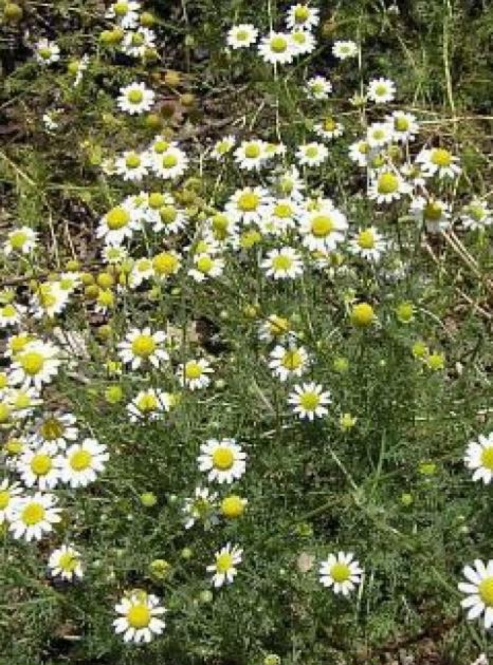
MANZANILLA BASTARDA, MANZANILLÓN, HIERBA HEDIONDA, FALSA MANZANILLA ( Anthemis cotula )