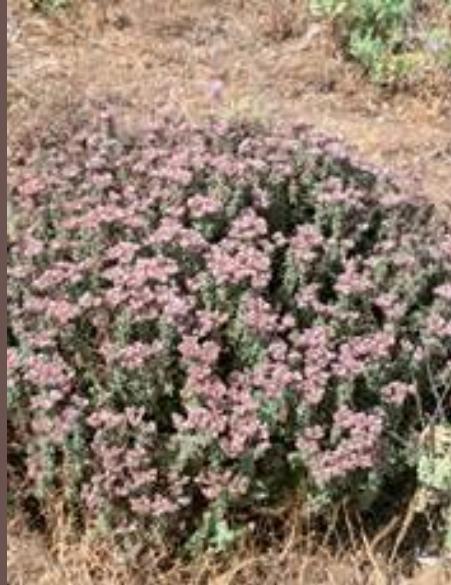
SANGUINARIA ( Chorizante vaginata )