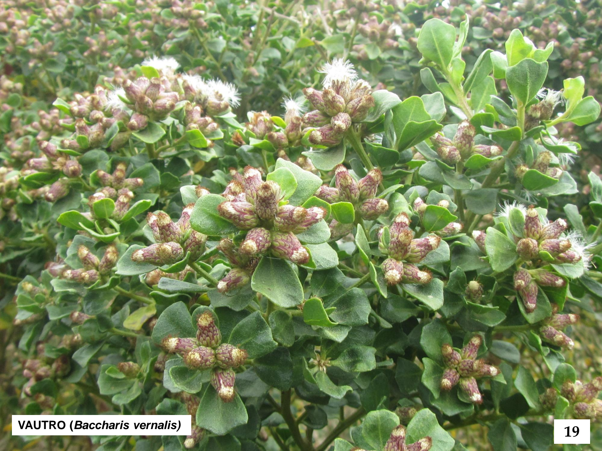
VAUTRO ( Baccharis vernalis )