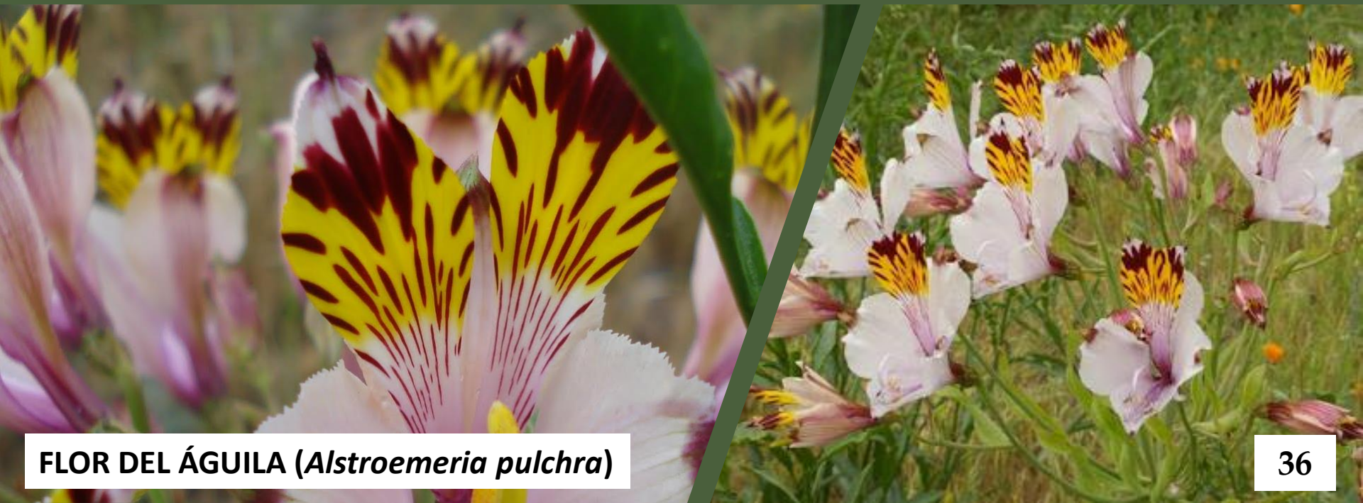
FLOR DEL ÁGUILA ( Alstroemeria pulchra )