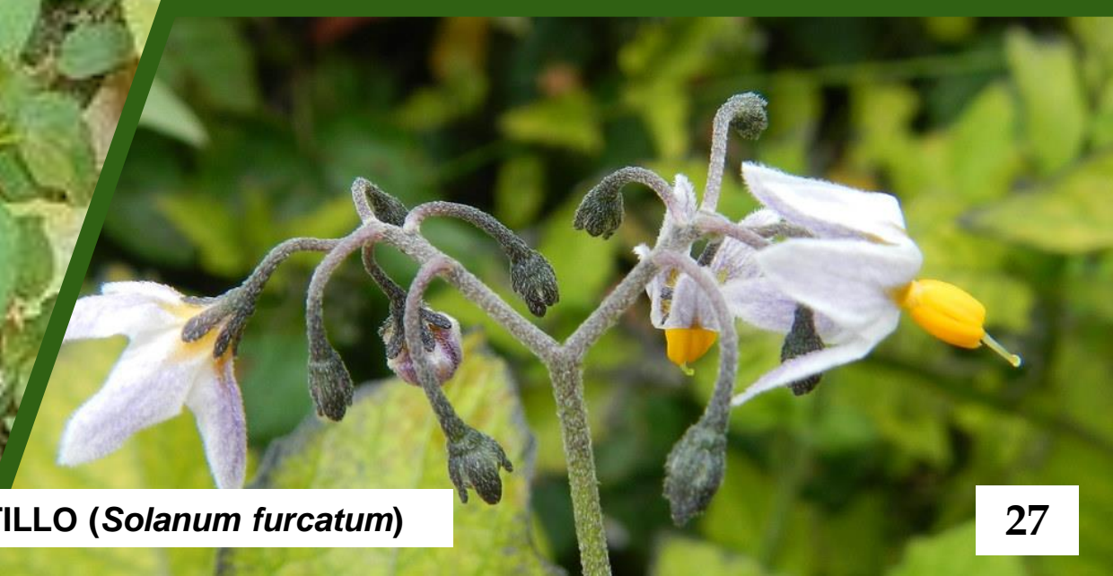
TOMATILLO ( Solanum furcatum )