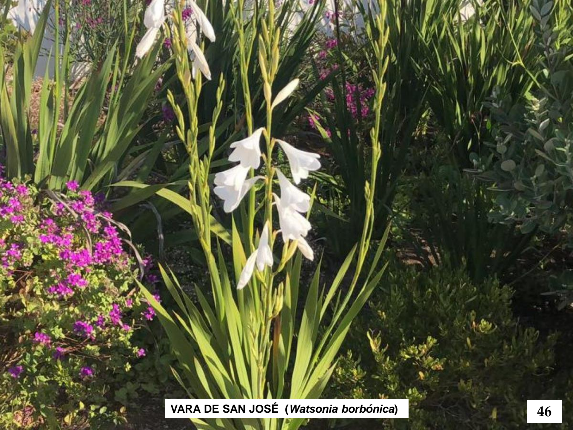
VARA DE SAN JOSÉ ( Watsonia borbónica )