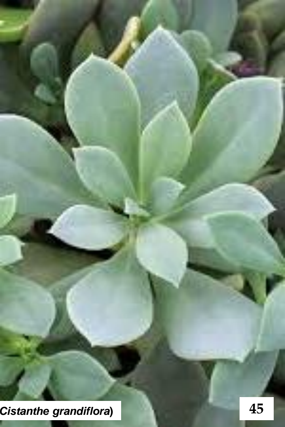
PATA DE GUANACO ( Cistanthe grandiflora )