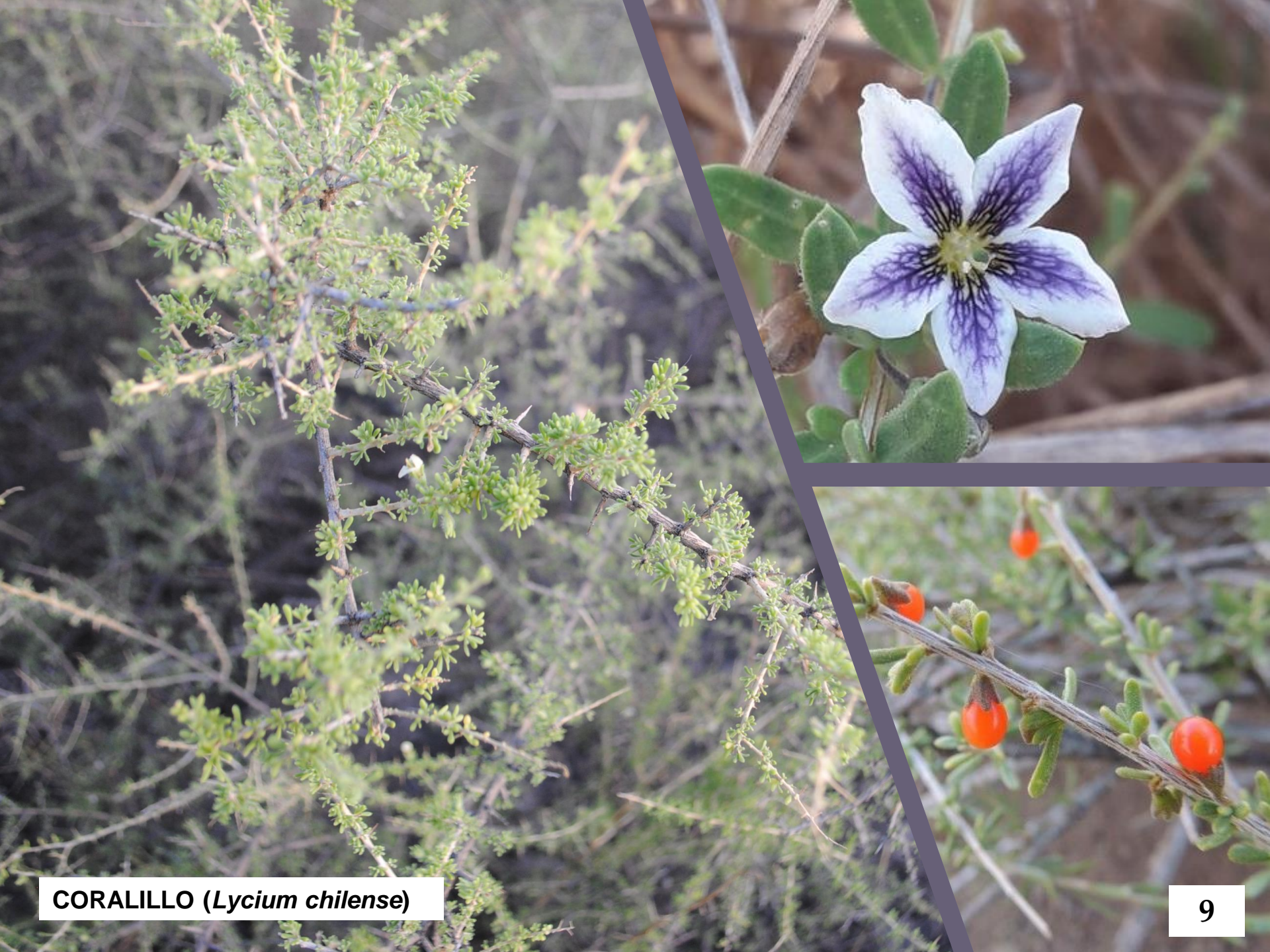
CORALILLO ( Lycium chilense )