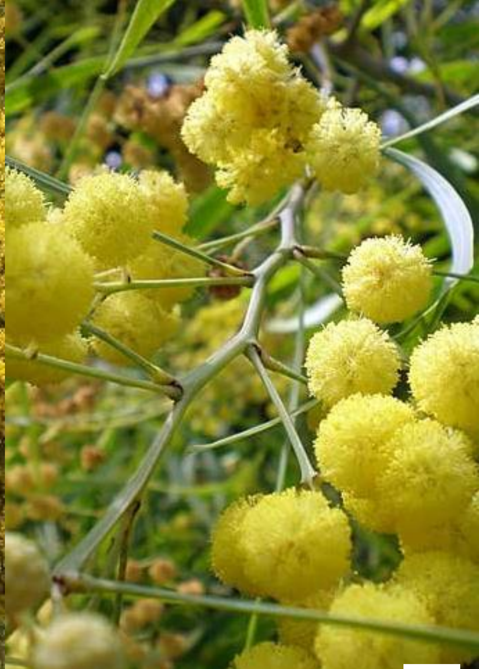
AROMO ( Acacia saligna )