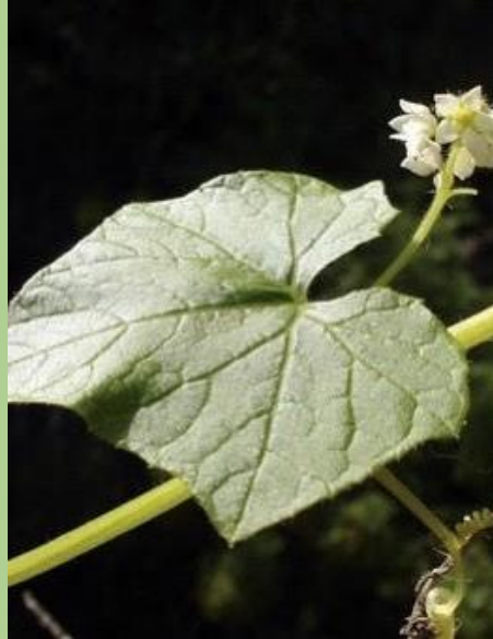
CALABACILLO ( Sicyos baderoa )