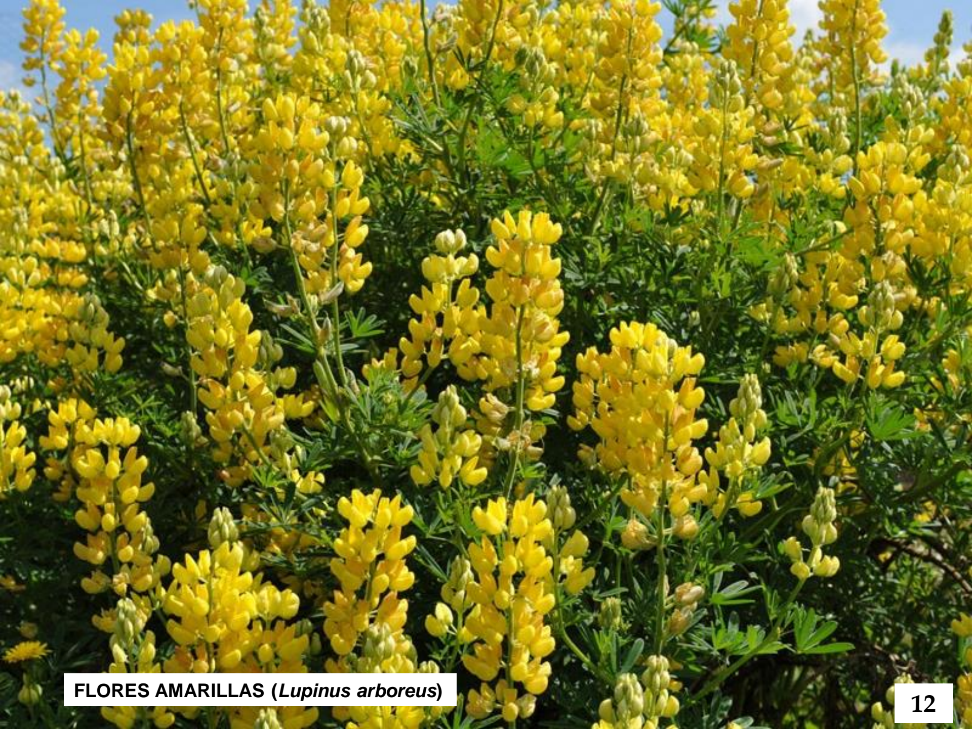
FLORES AMARILLAS ( Lupinus arboreus )