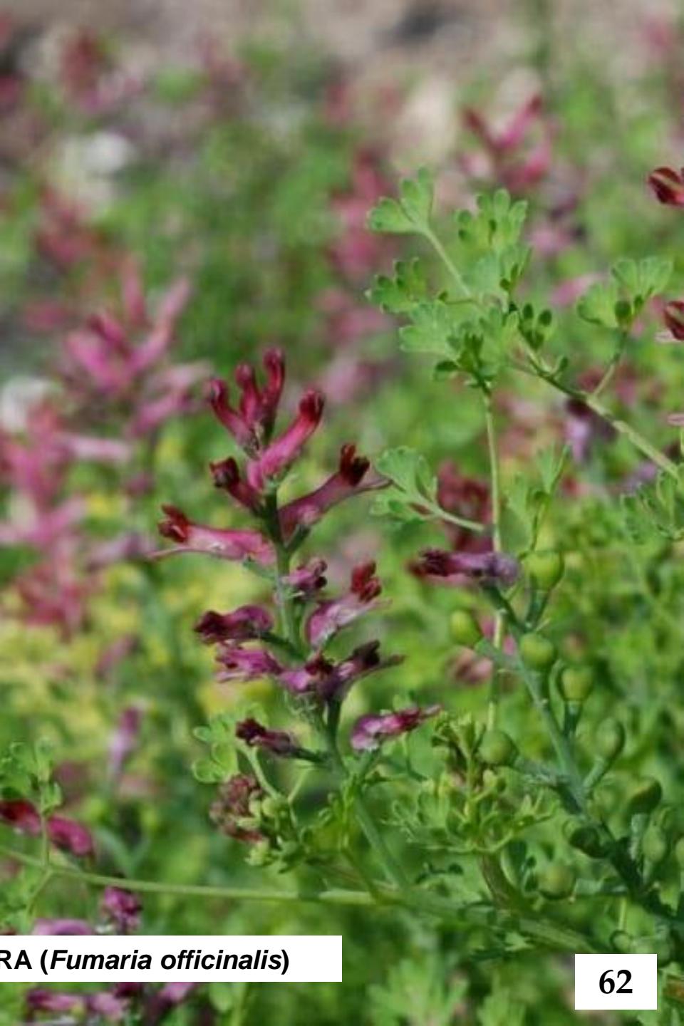
HIERBA DE LA CULEBRA ( Fumaria officinalis )