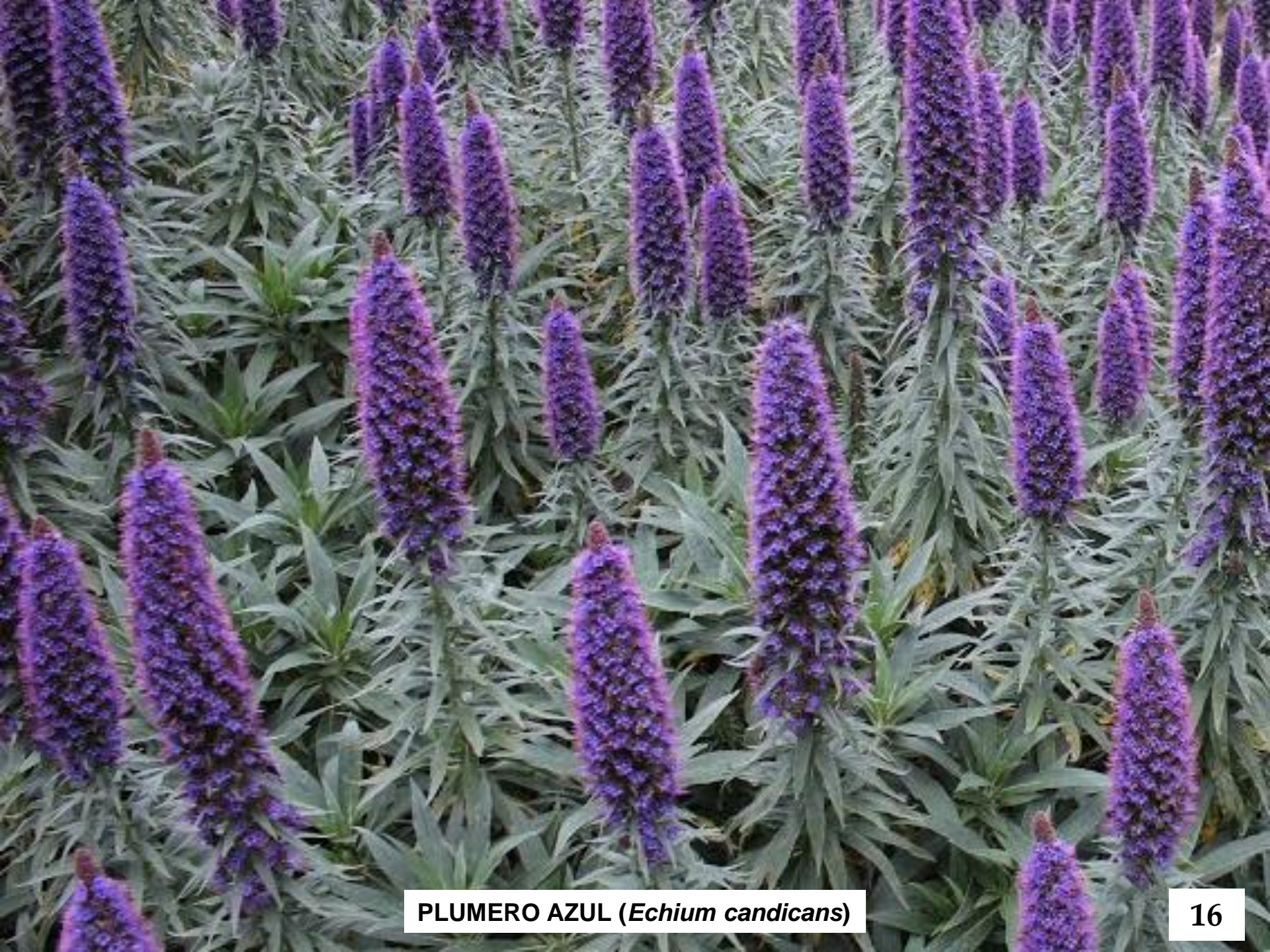
PLUMERO AZUL ( Echium candicans )