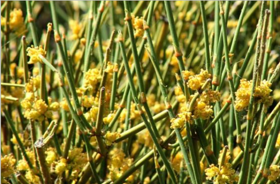
PINGO PINGO ( Ephedra chilensis )