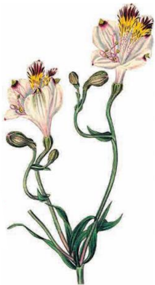
Vol. I. N° 2421 Alstroemeria pulchra Año 1823