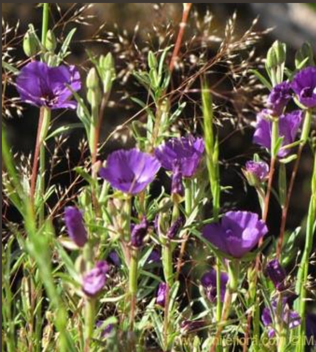
HUASITA DEL CAMPO ( Clarkia tenella )