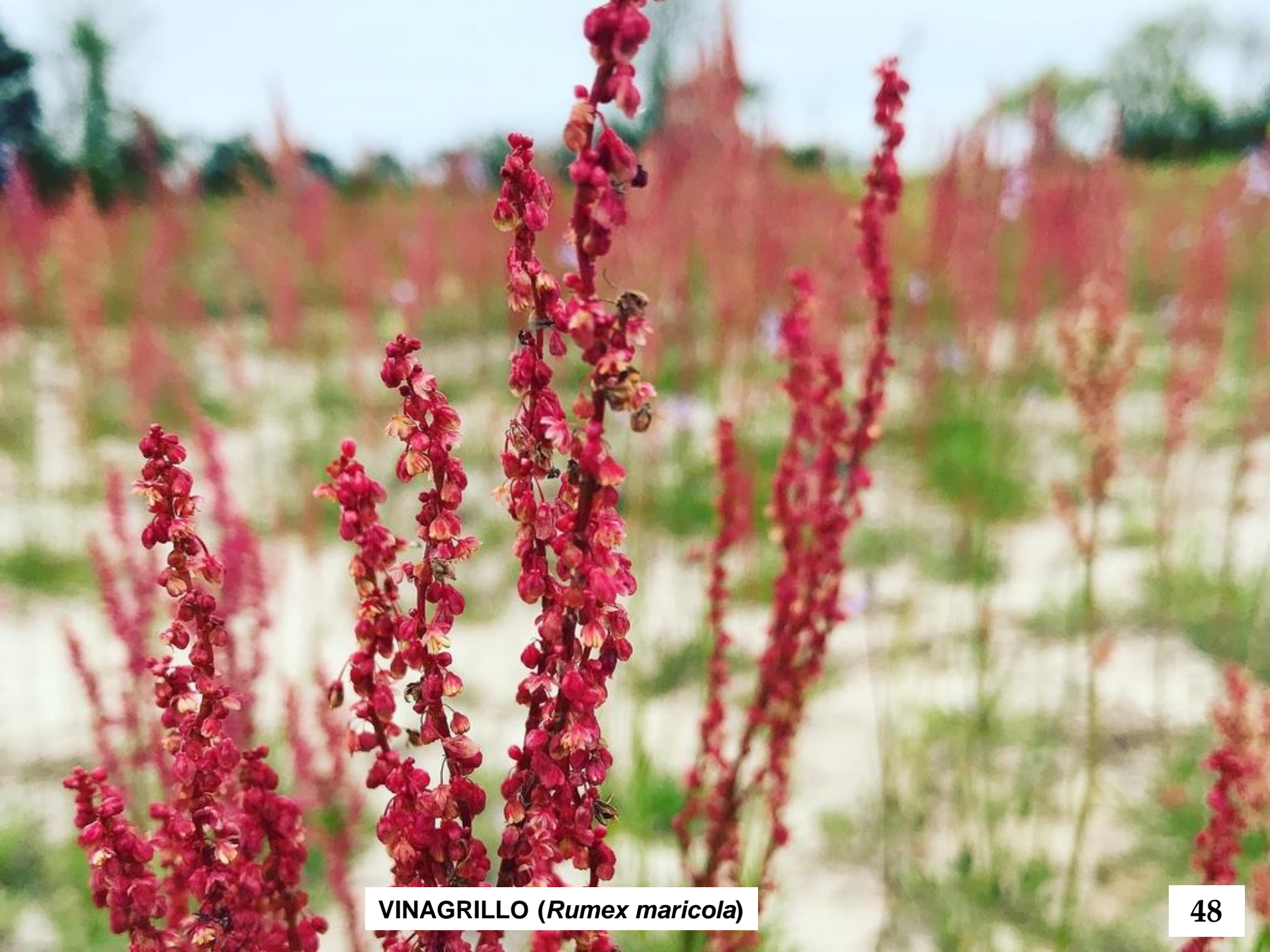
VINAGRILLO ( Rumex maricola )