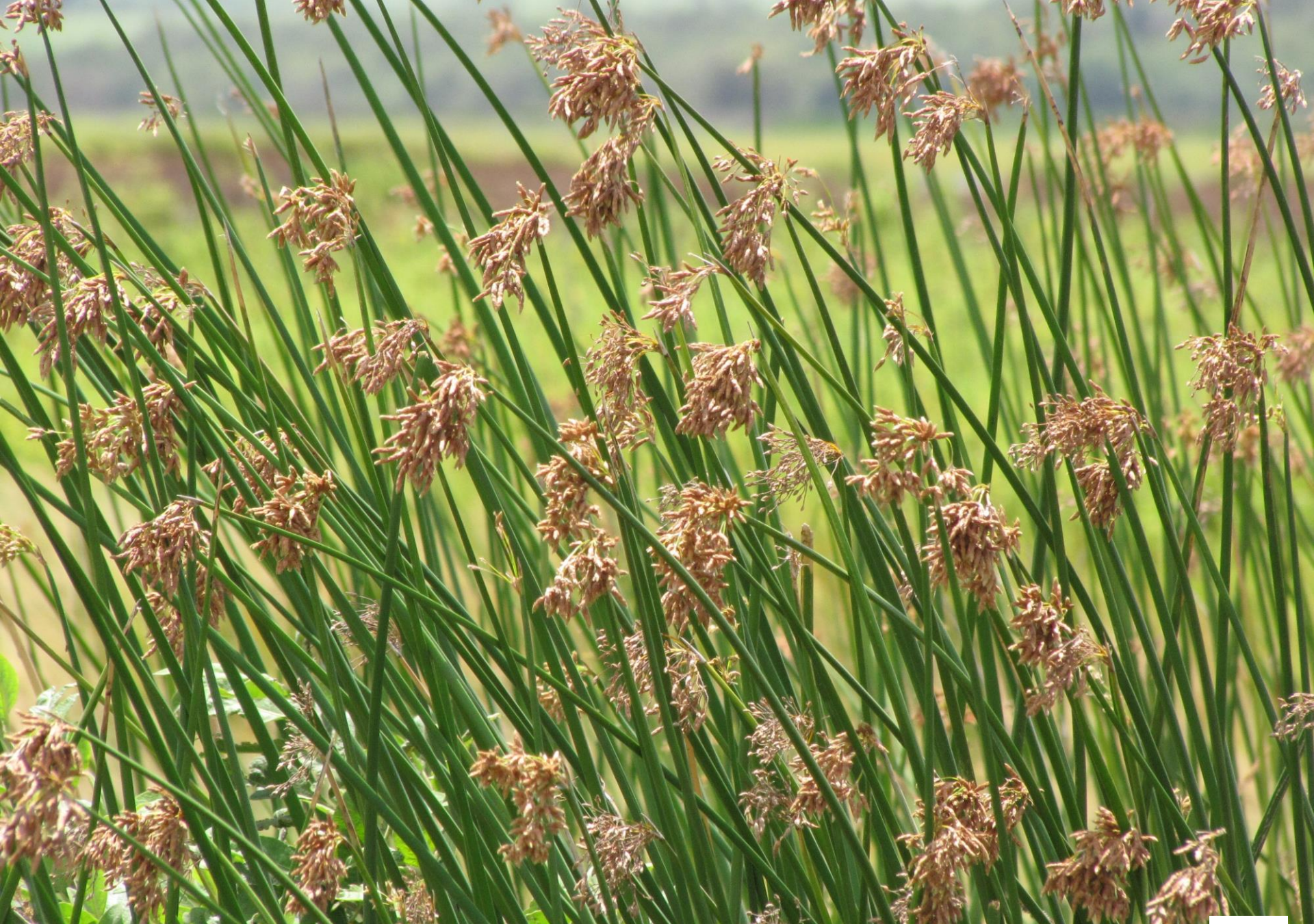
JUNQUILLO ( Schoenoplectus californicus )