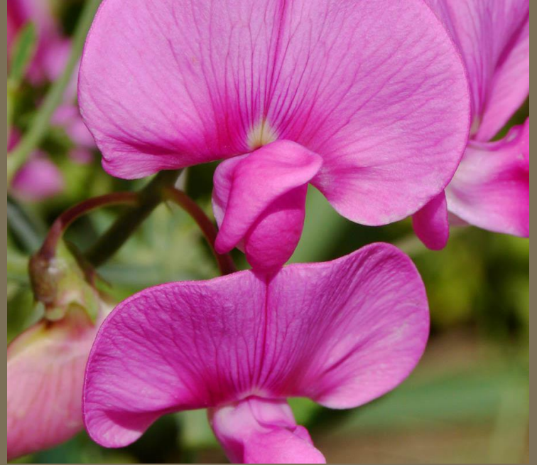
ARVEJILLA ( Lathyrus odoratus )