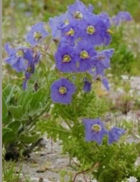
TOMATILLO ( Solanum heterantherum )