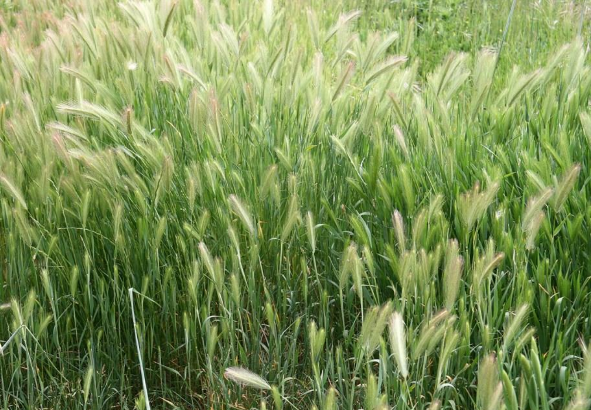
CEBADILLA ( Hordeum murinum )