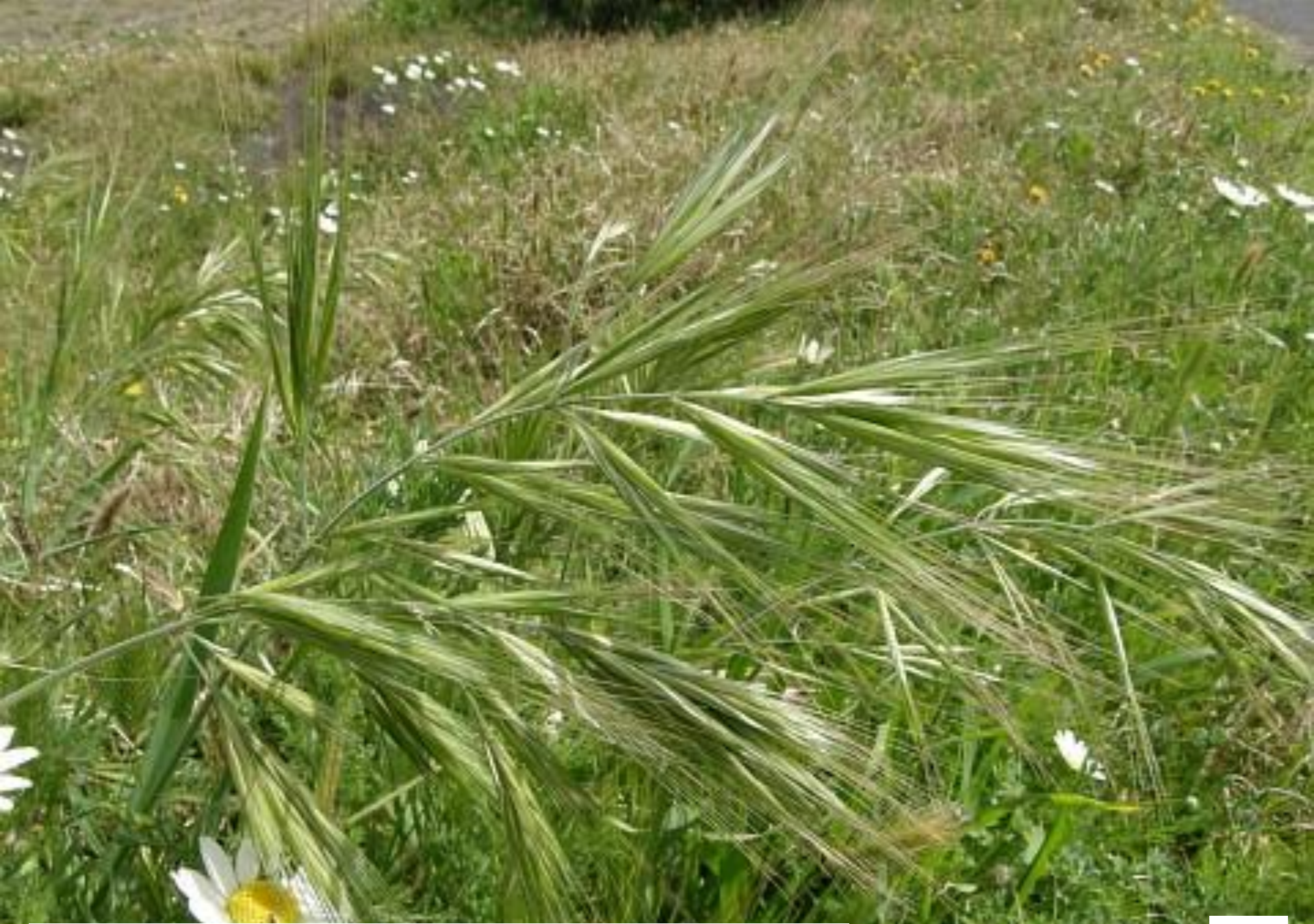
PASTO DEL PERRO, BROMO, PASTO PELUDO ( Bromus rigidus )