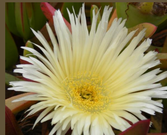
DOCA CHILENA ( Carpobrotus chilensis )