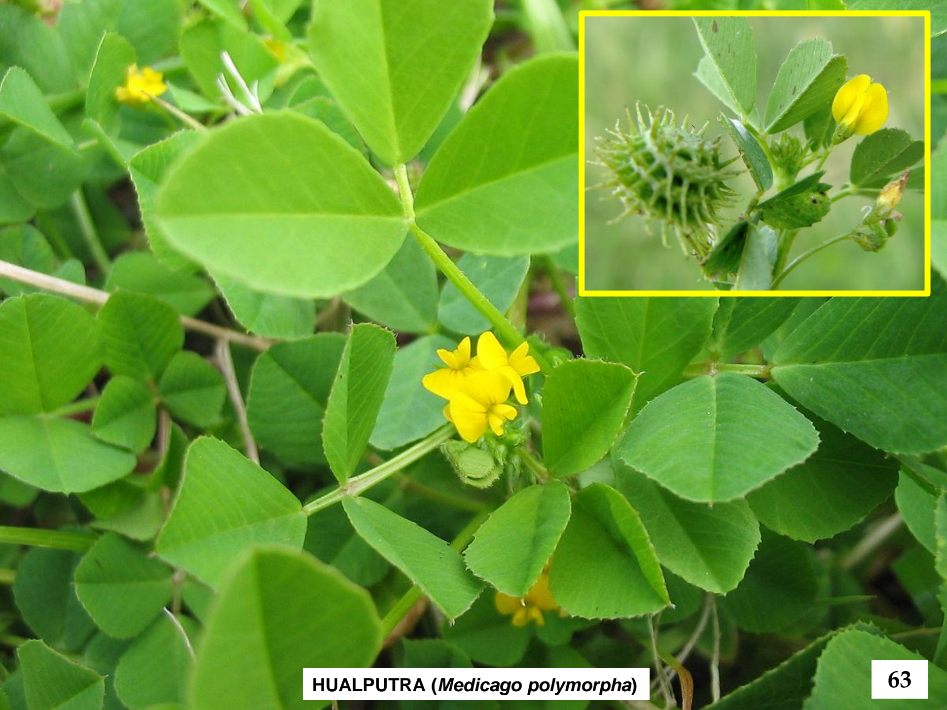
HUALPUTRA ( Medicago polymorpha )