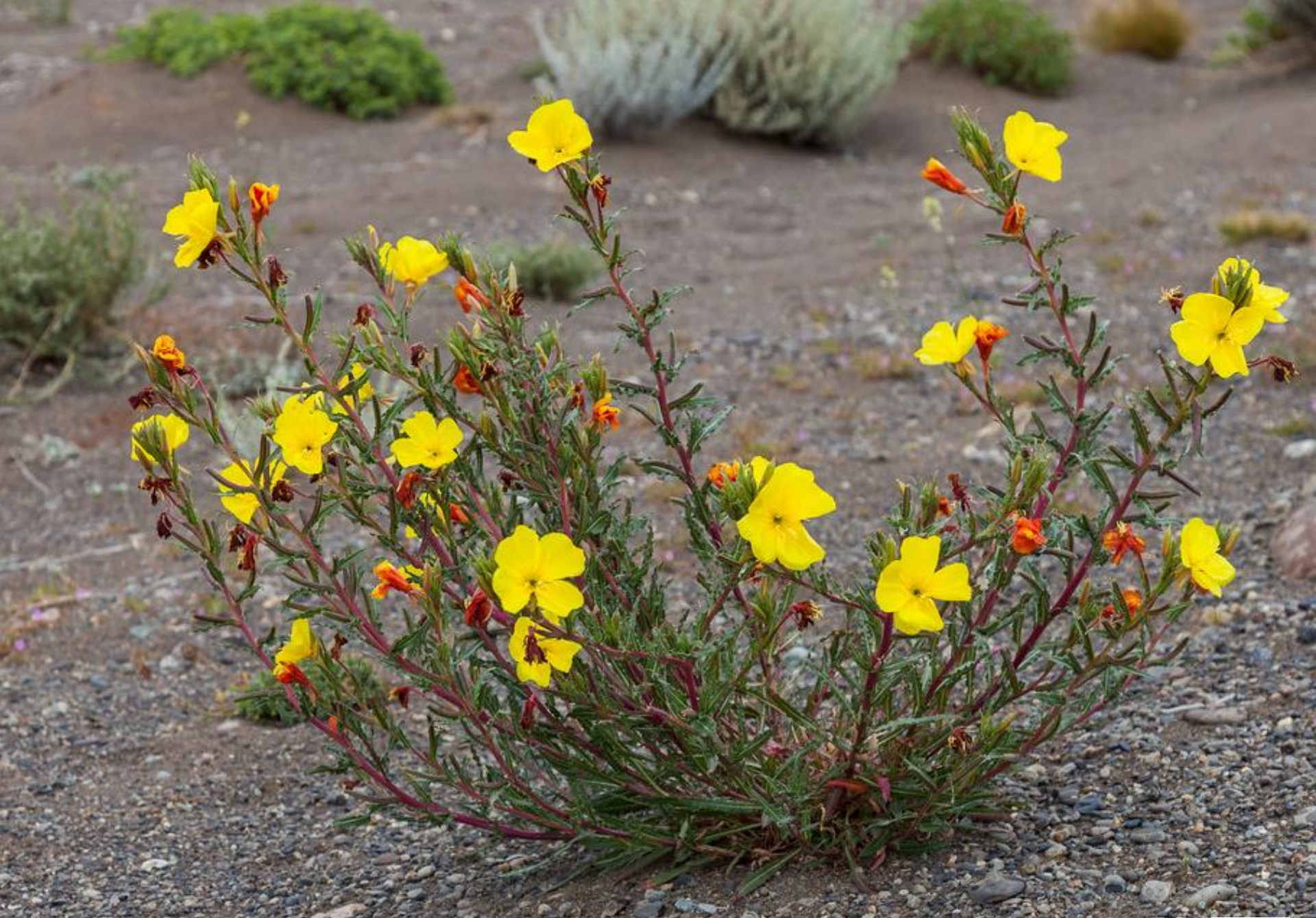
DON DIEGO DE LA NOCHE ( Oenothera affinis )