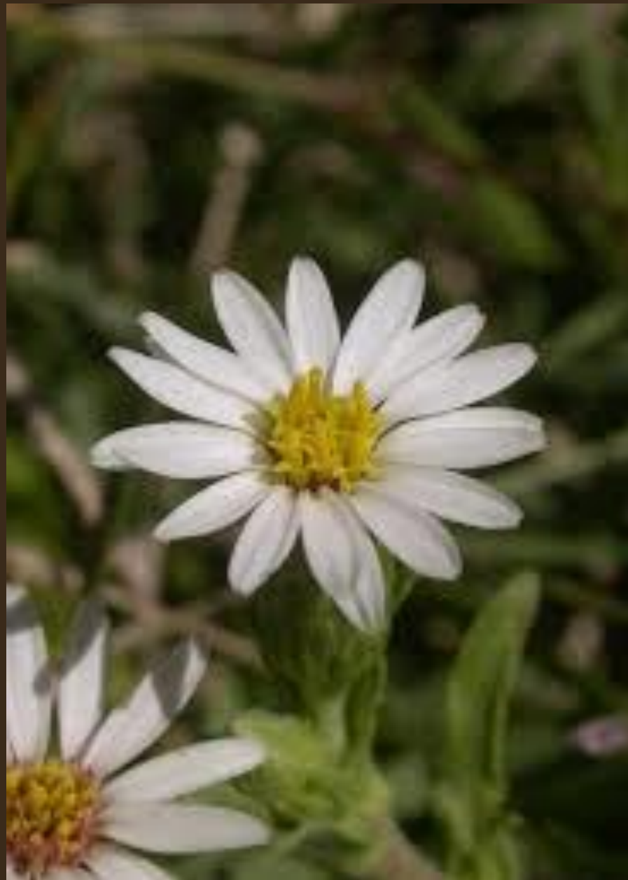
ESTRELLITA PLATEADA ( Noticastrum sericeum )