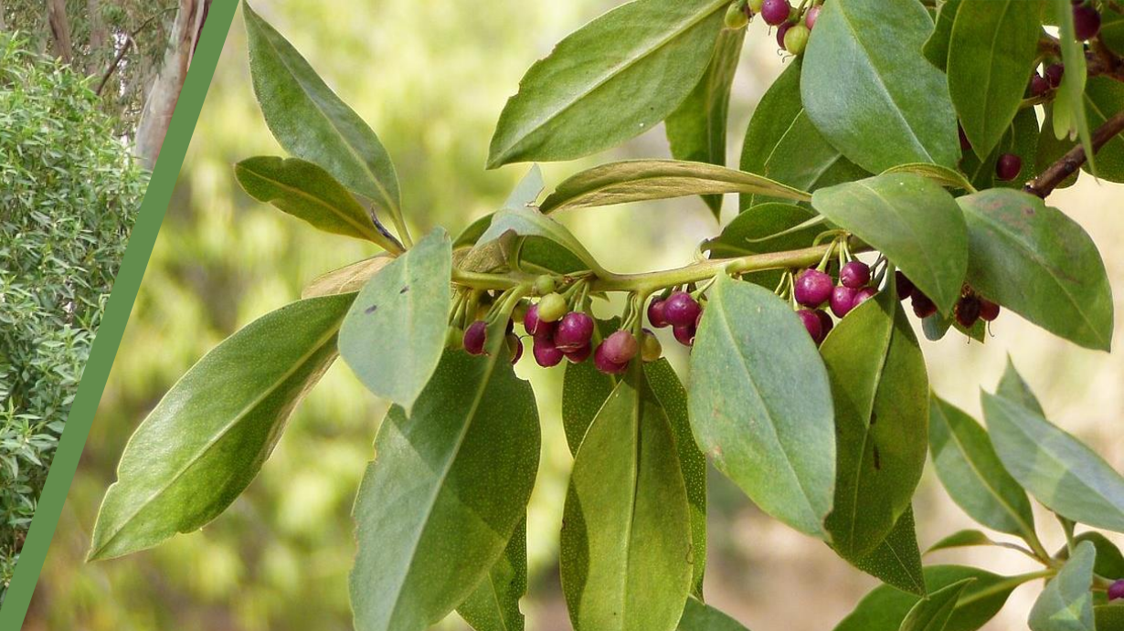
MIOPORO ( Myoporum laetum )