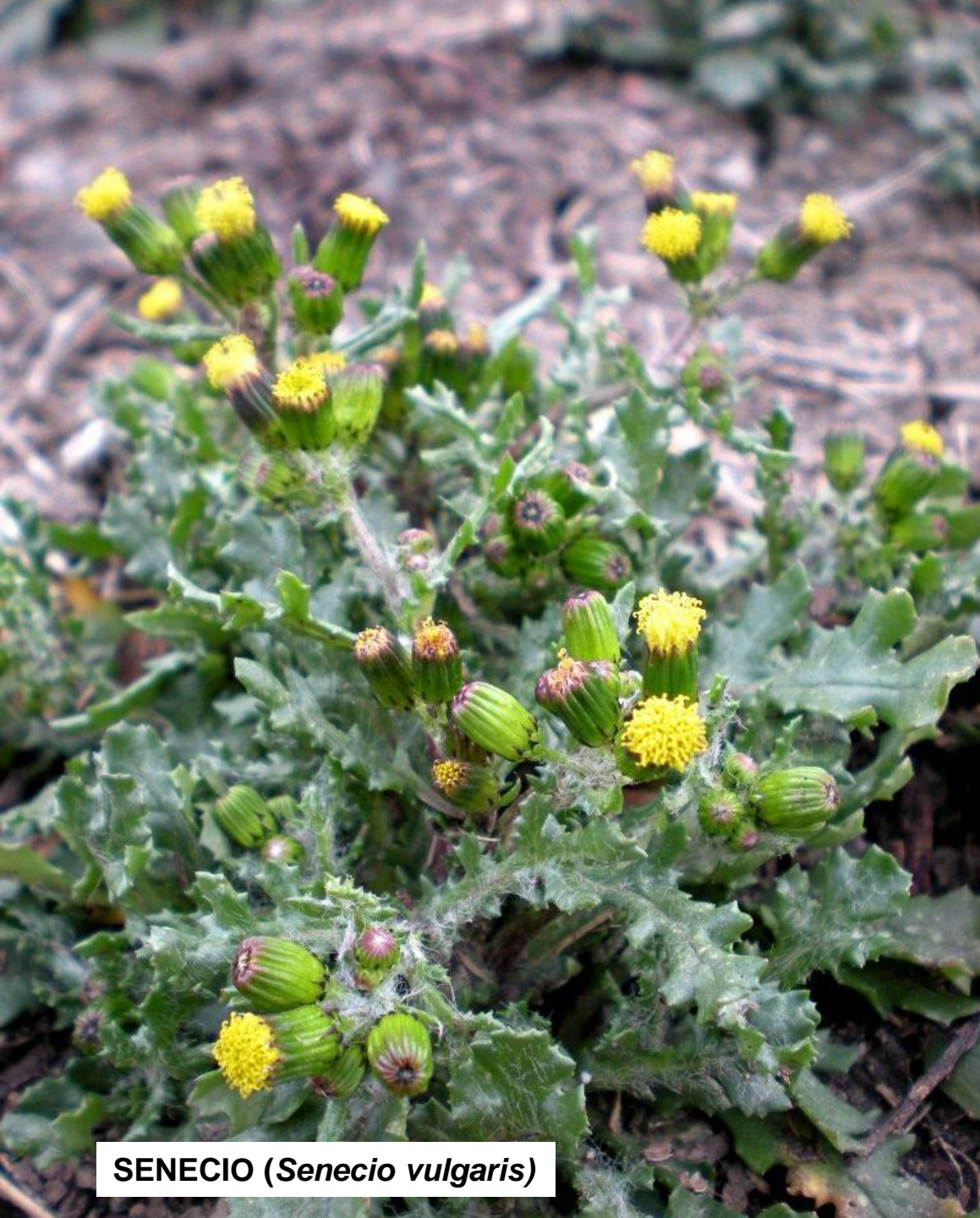
SENECIO ( Senecio vulgaris )