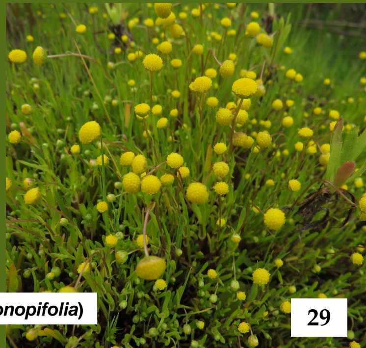
BOTÓN DE ORO ( Cotula coronopifolia )