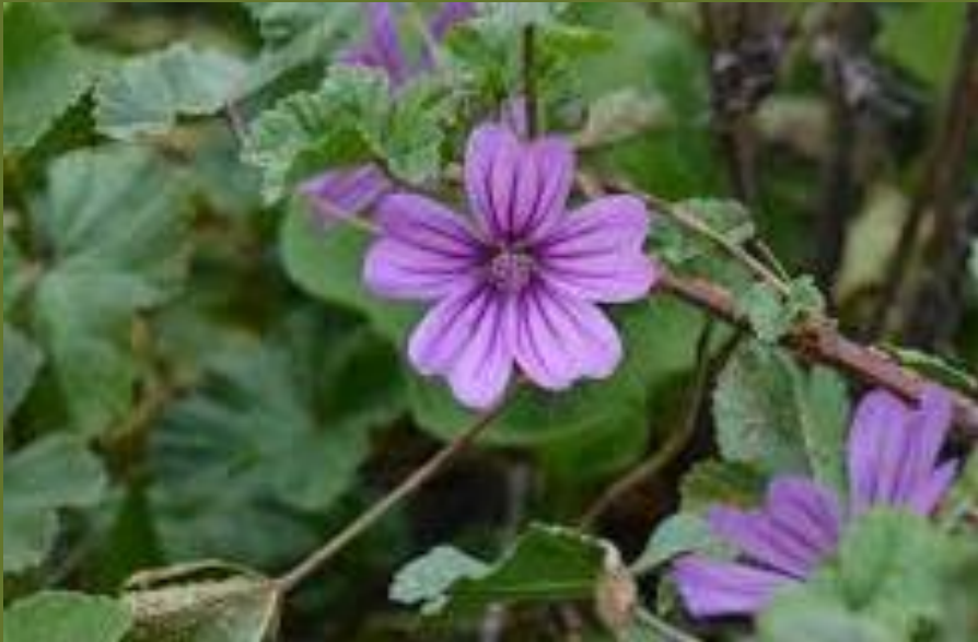
MALVA ( Malva sylvestris )