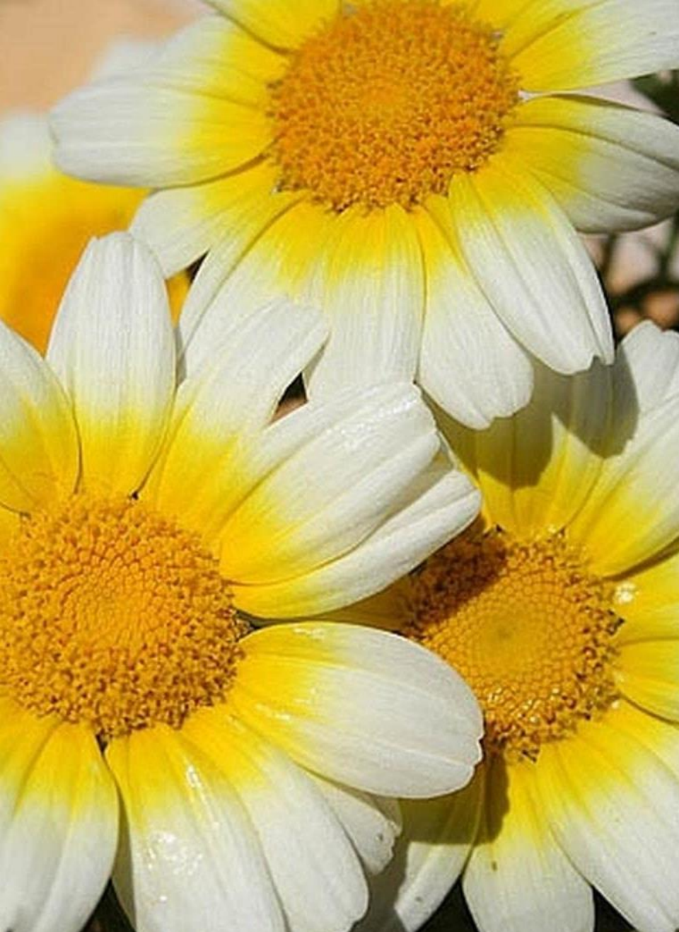
MANZANILLÓN, ANTIMANO, MANZANILLA DE FLOR DORADA, MIRABELES , OJO DE BUEY ( Chrysanthemum coronarium )