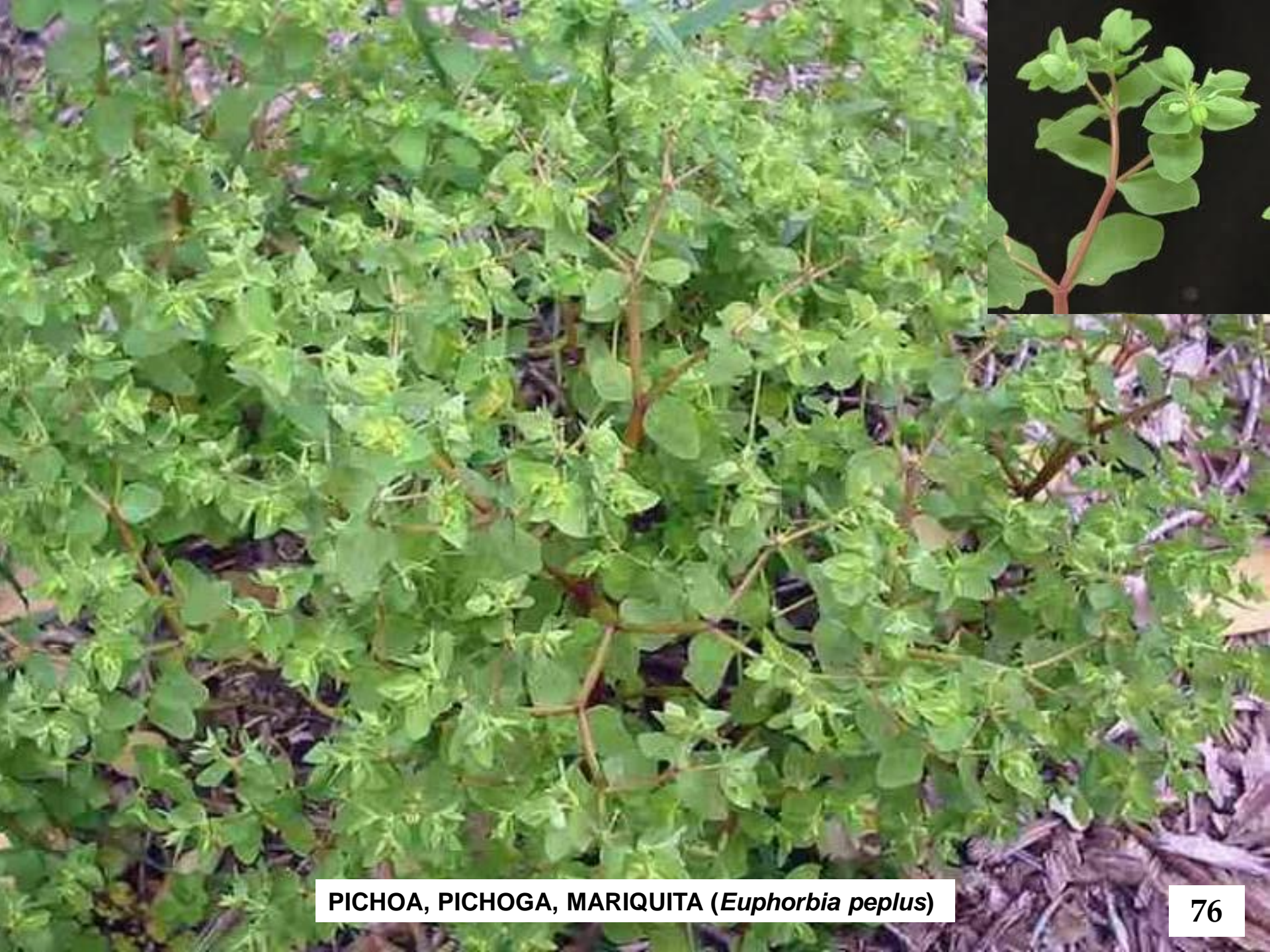
PICHOA, PICHOGA, MARIQUITA ( Euphorbia peplus )