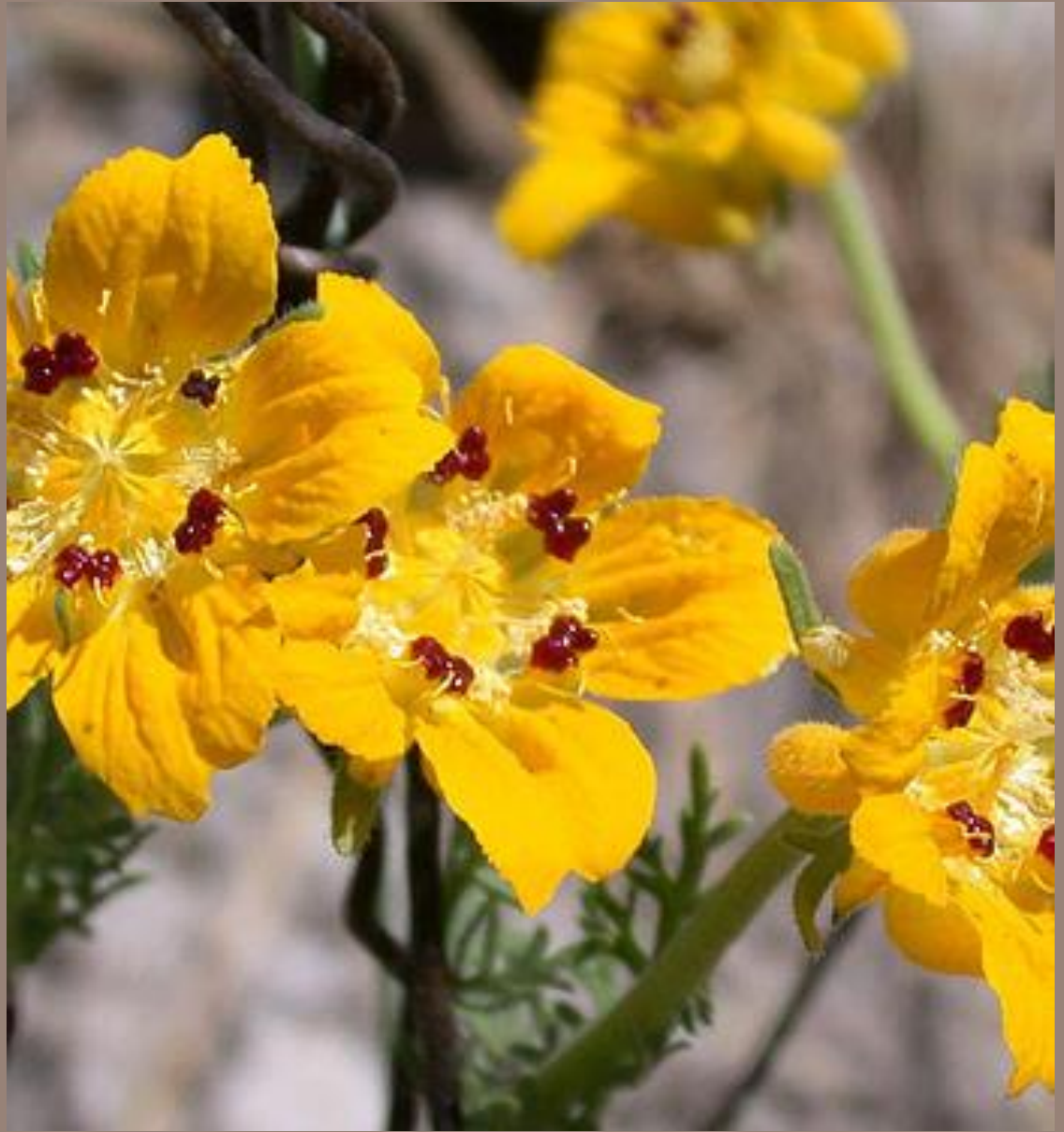
MONJITA ( Scyphanthus elegans )