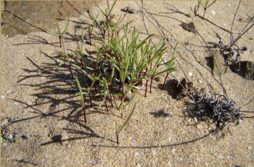
PASTO OVEJERO ( Plantago hispidula )