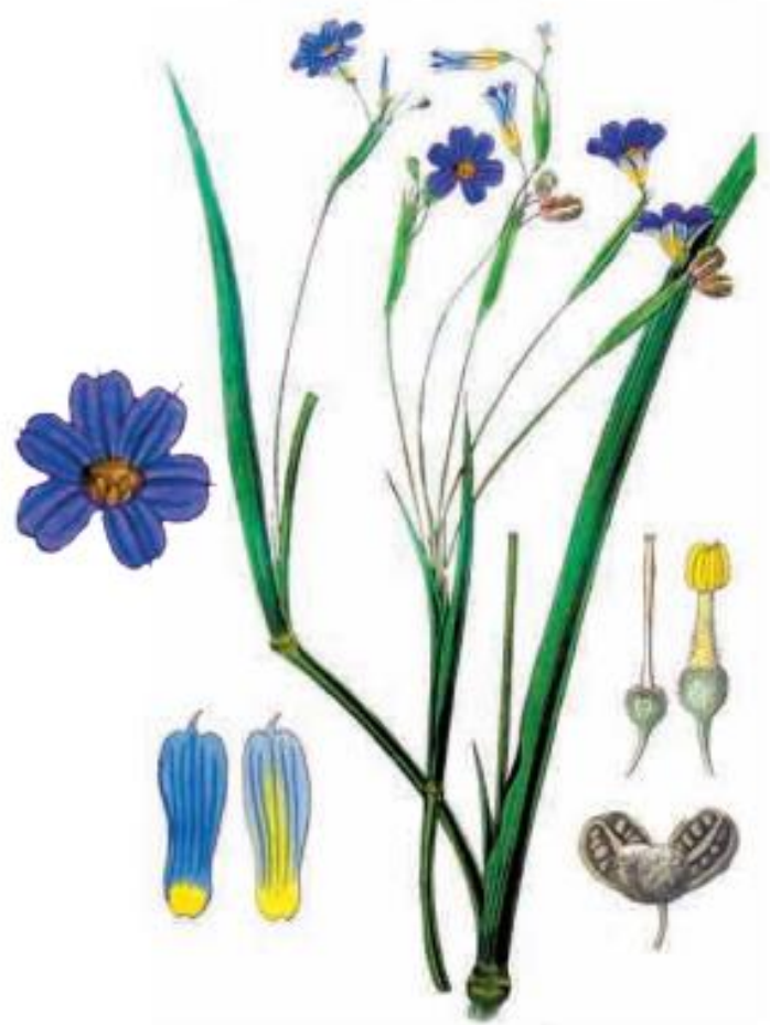
; Sisyrrinchium chilense Año 1827 El Chillean sisyrrinchium según lo llama el Botanical Magazine