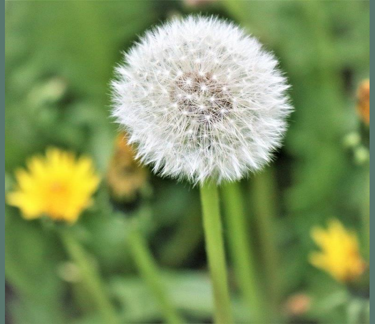
ÑILHUE ( Sonchus oleraceus )