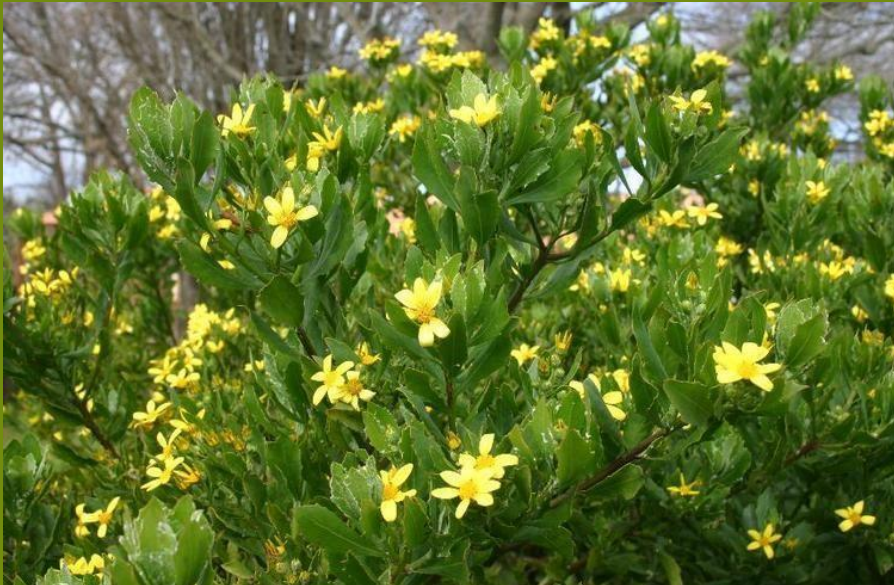
CRISANTEMO ( Chrysanthemoides monilifera )