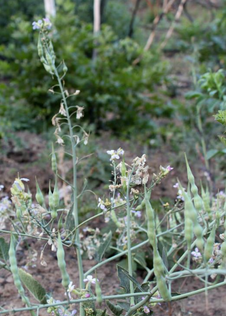
RÁBANO ( Raphanus sativus )