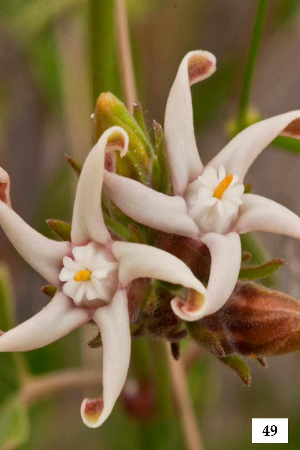
VOQUICILLO, INCIENSO ( Tweedia birostrata )