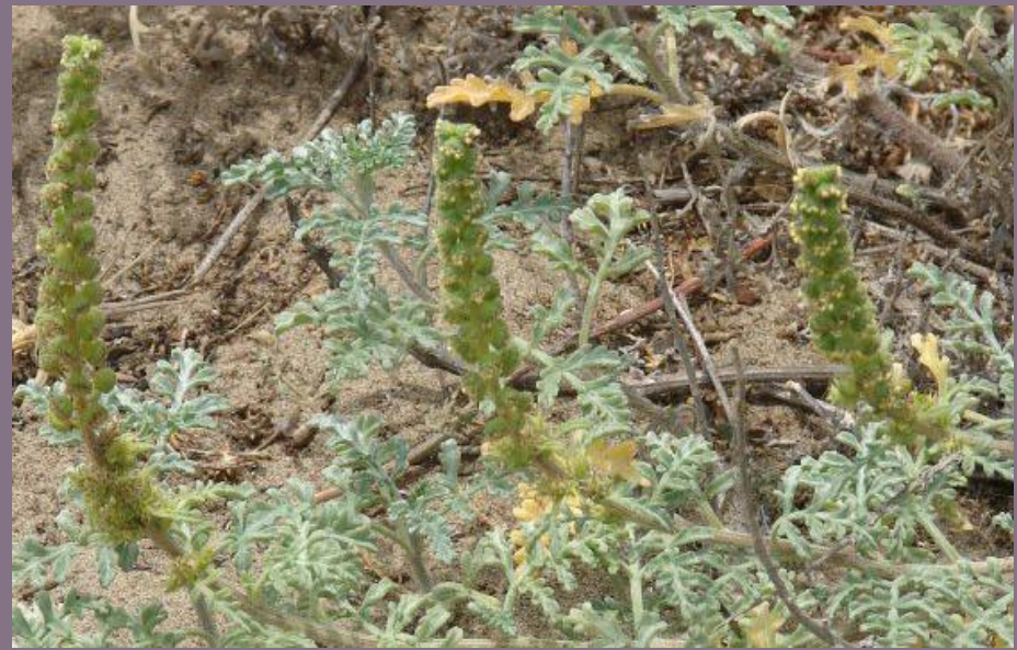
CLONQUE, AMBROSIA ( Ambrosia chamissonis )