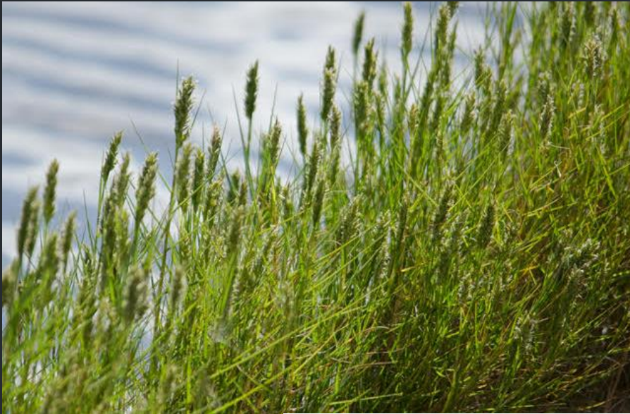
GRAMA, GRAMILLO, GRAMASALADA, CHÉPICA ( Distichlis spicata )