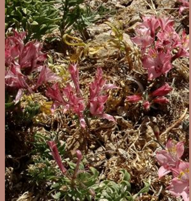
LIRIO COSTERO ( Alstroemeria hookeri var. recumbens )