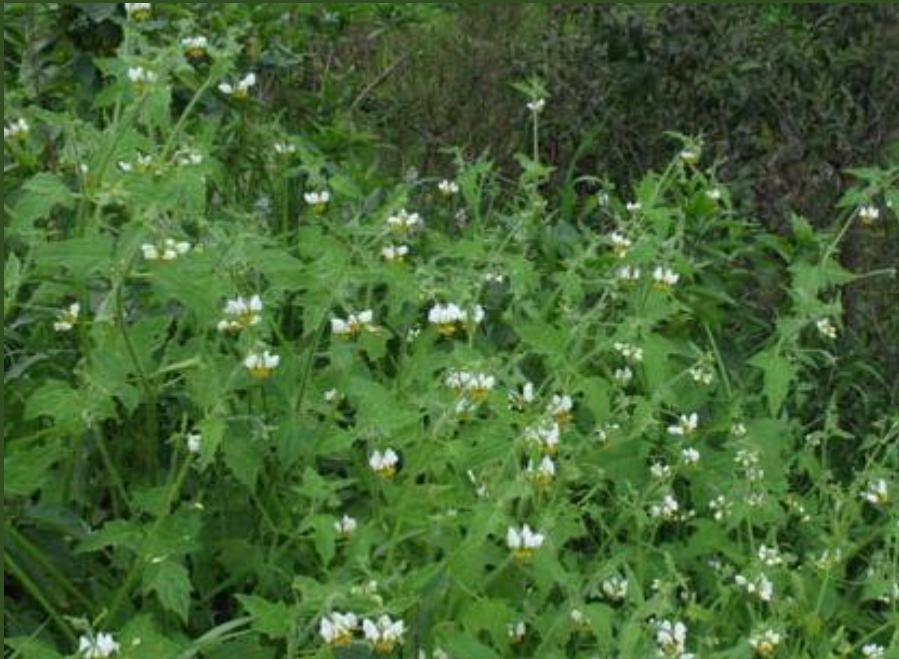
ORTIGA BLANCA ( Loasa triloba )