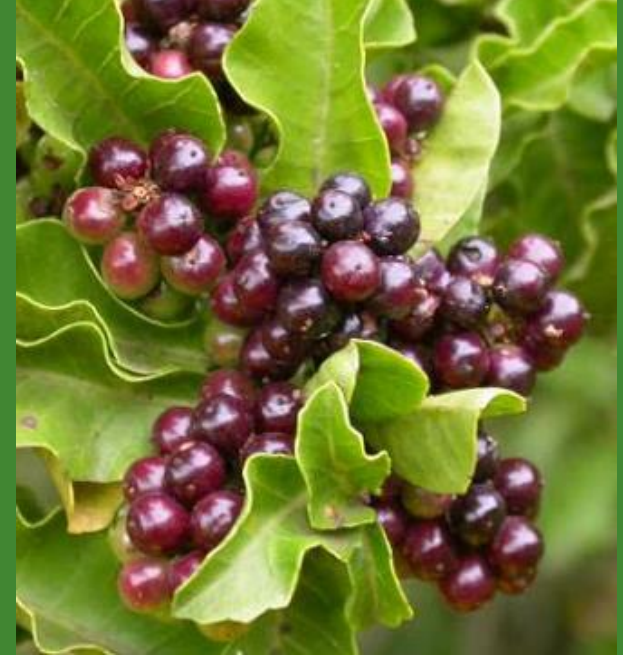
MOLLE ( Schinus latifolius )