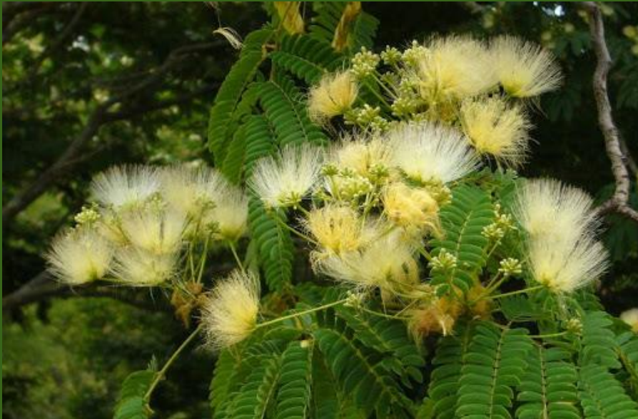
ALBIZIA ( Albizia lophanta )