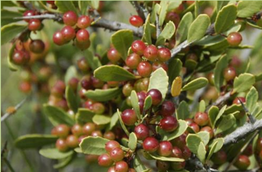
HUINGÁN ( Schinus polygamus )