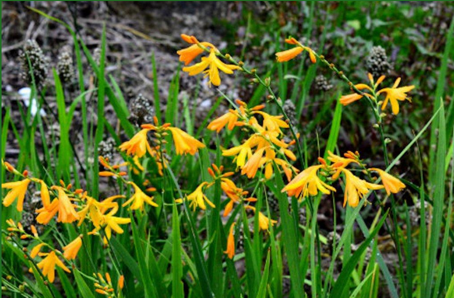
CROCOSMIA, MONTBRESIA ( Crocasmia crocosmiiflora )