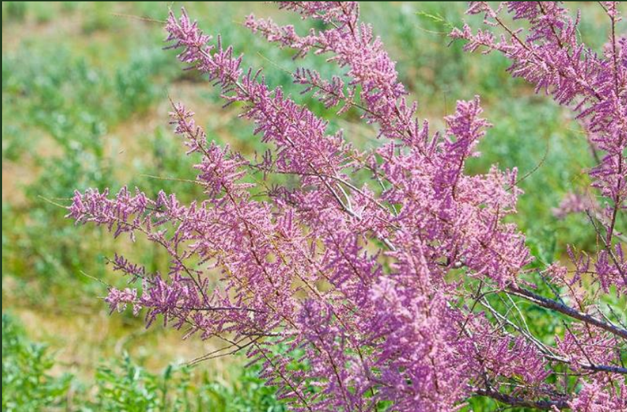
TAMARINDO ( Tamarix ramosissima )