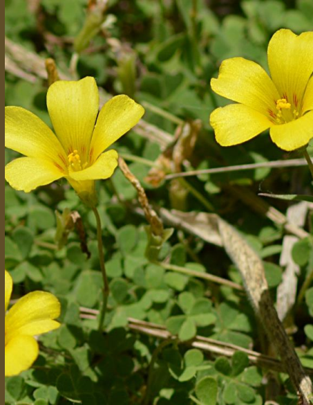
VINAGRILLO ( Oxalis megalorrhiza )