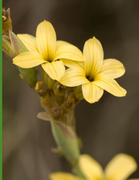
HUILMO ( Sisyrinchium arenarium )