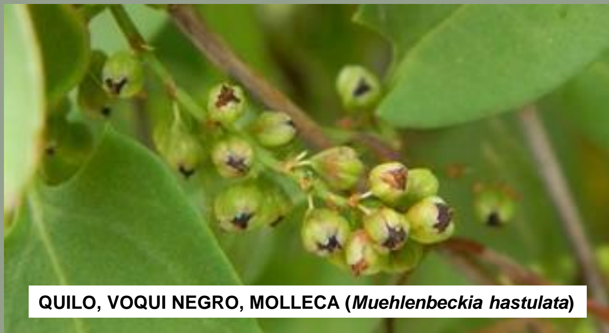
QUILO, VOQUI NEGRO, MOLLECA ( Muehlenbeckia hastulata )