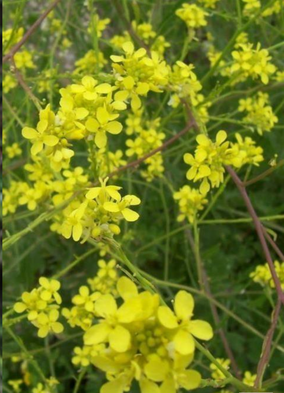
MOSTACILLA ( Hirschfeldia incana )