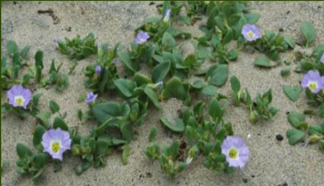
SUSPIRO DEL MAR ( Nolana paradoxa )