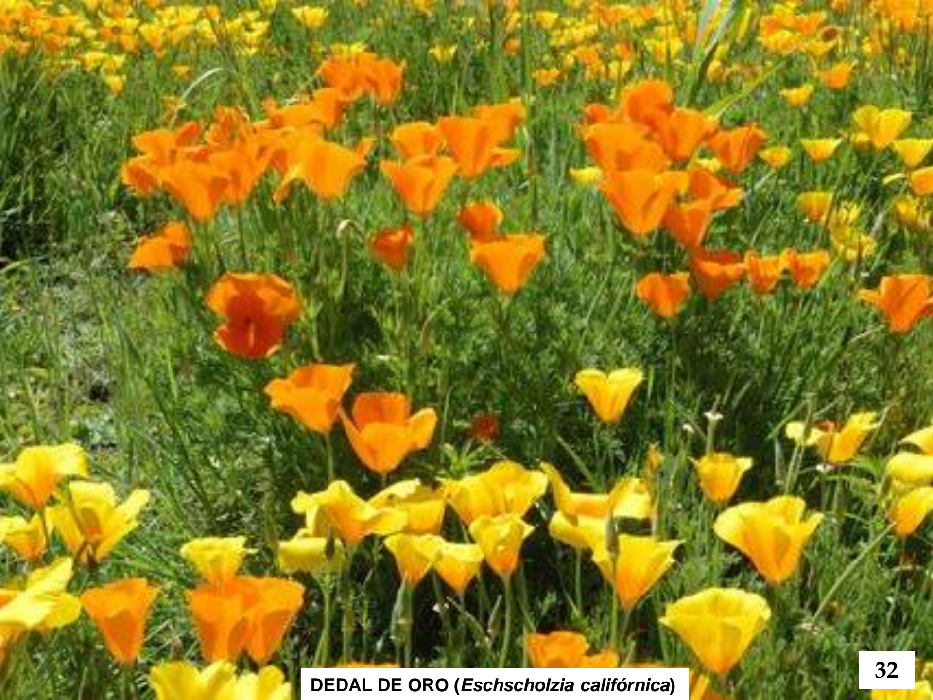
DEDAL DE ORO ( Eschscholzia californica )