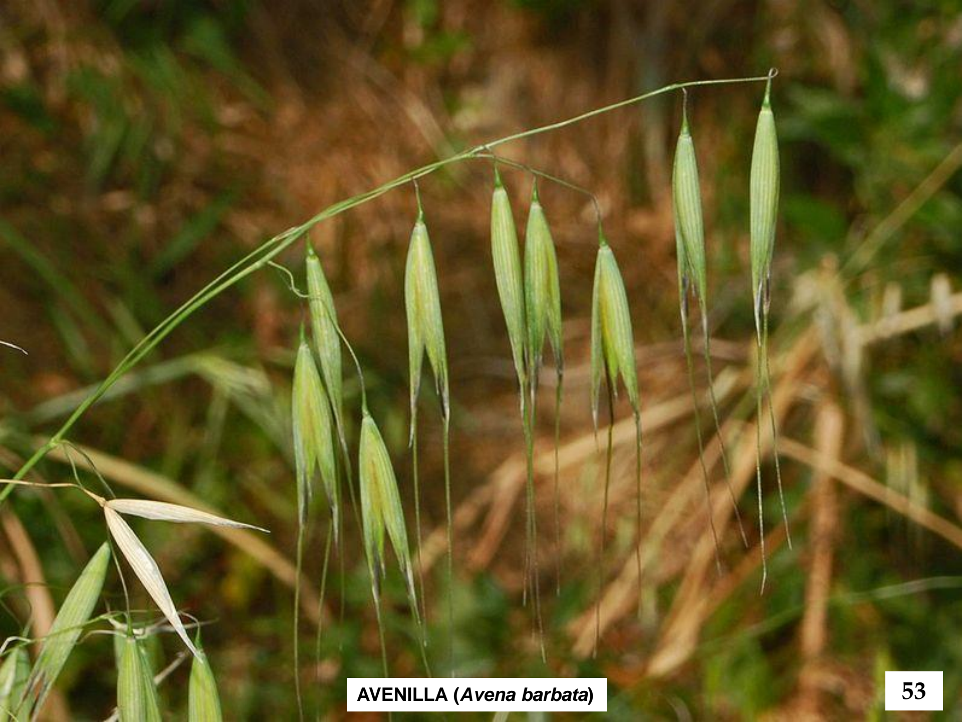
AVENILLA ( Avena barbata )