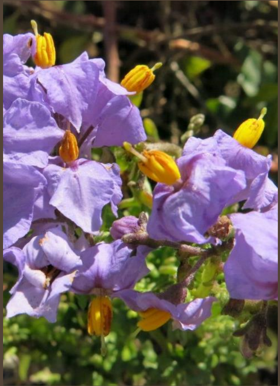
ESPARTO ( Solanum pinnatum )