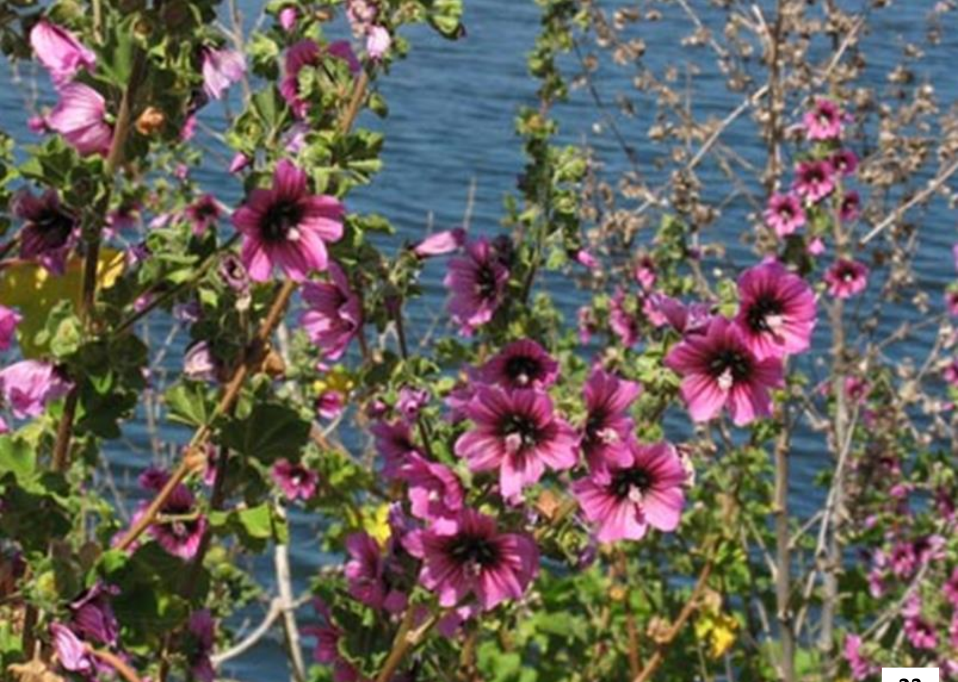
LAVATERA, MALVA LOCA ( Malva arborea )