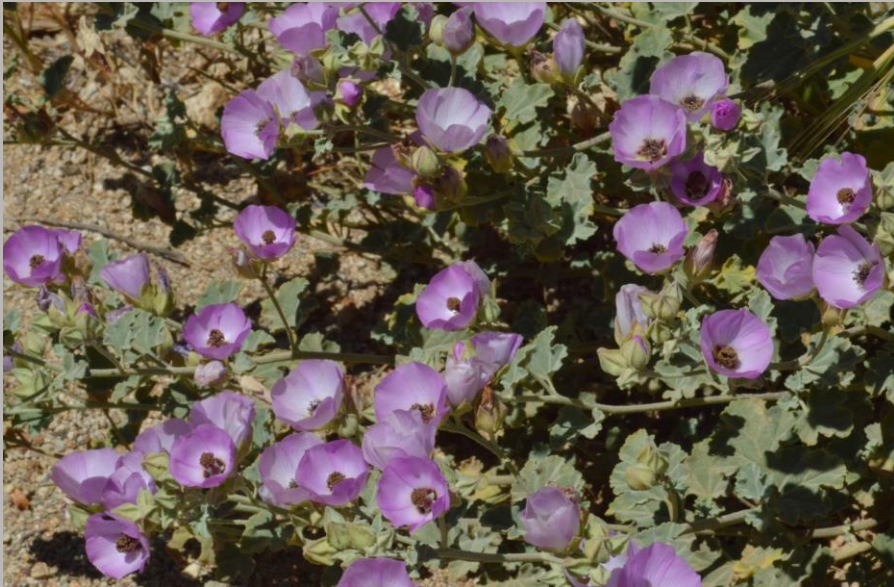
MALVILLA ( Cristaria glaucophylla )