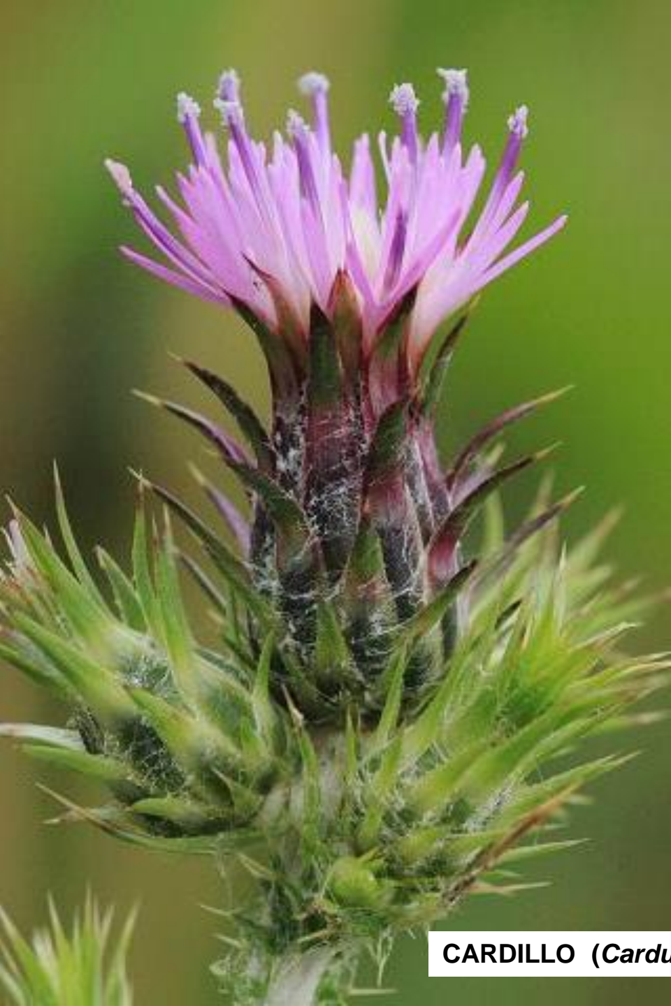
CARDILLO ( Cardus pycnocephalus )