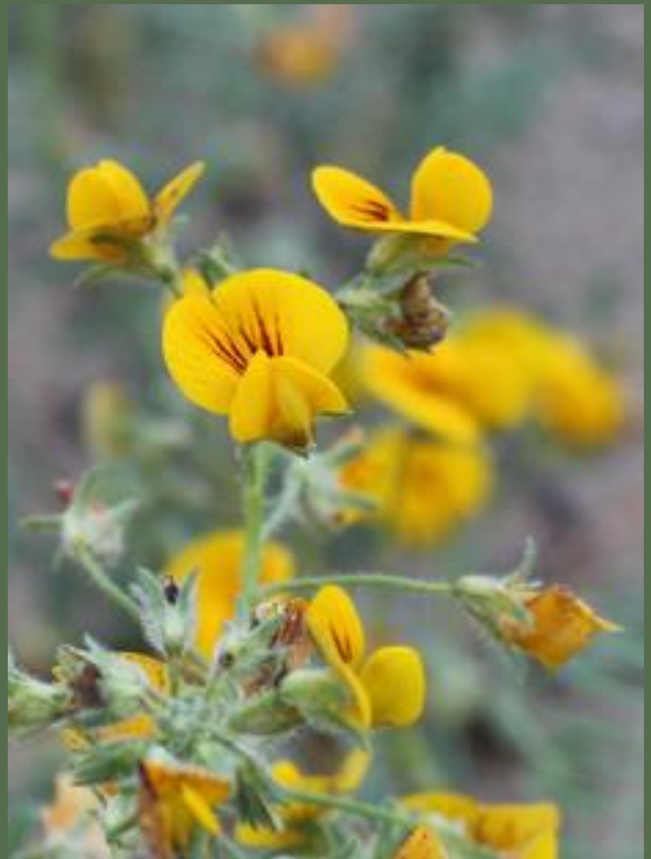
ARVEJILLA ( Adesmia tenella )