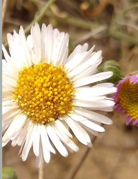
ESCABIOSA ( Erigeron fasciculatus )