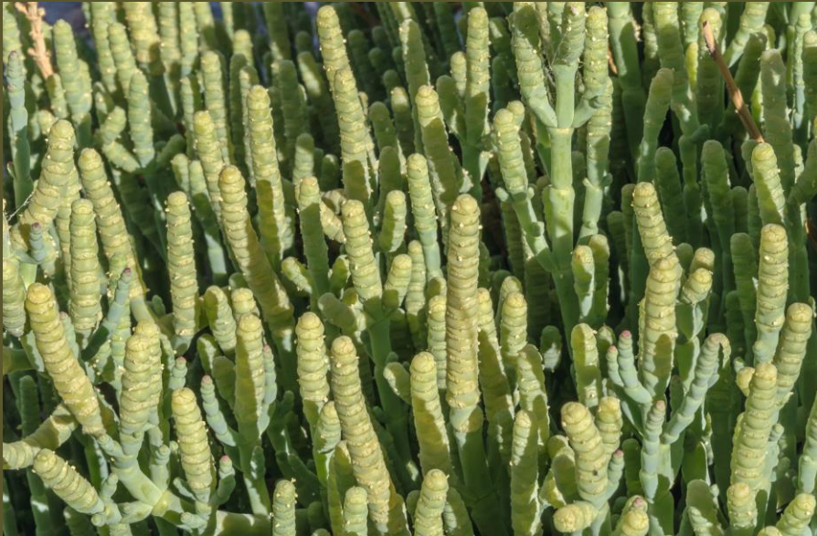
HIERBA SOSA, WALKAWALKA) ( Sarcocornia fruticosa )