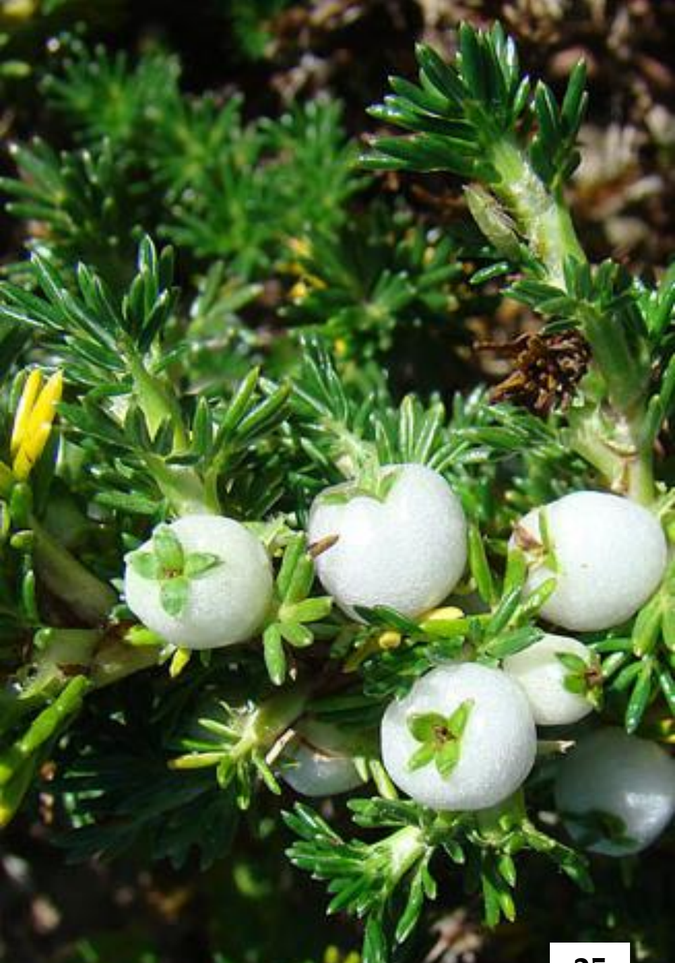
PERLILLA ( Margyricarpus pinnatus )