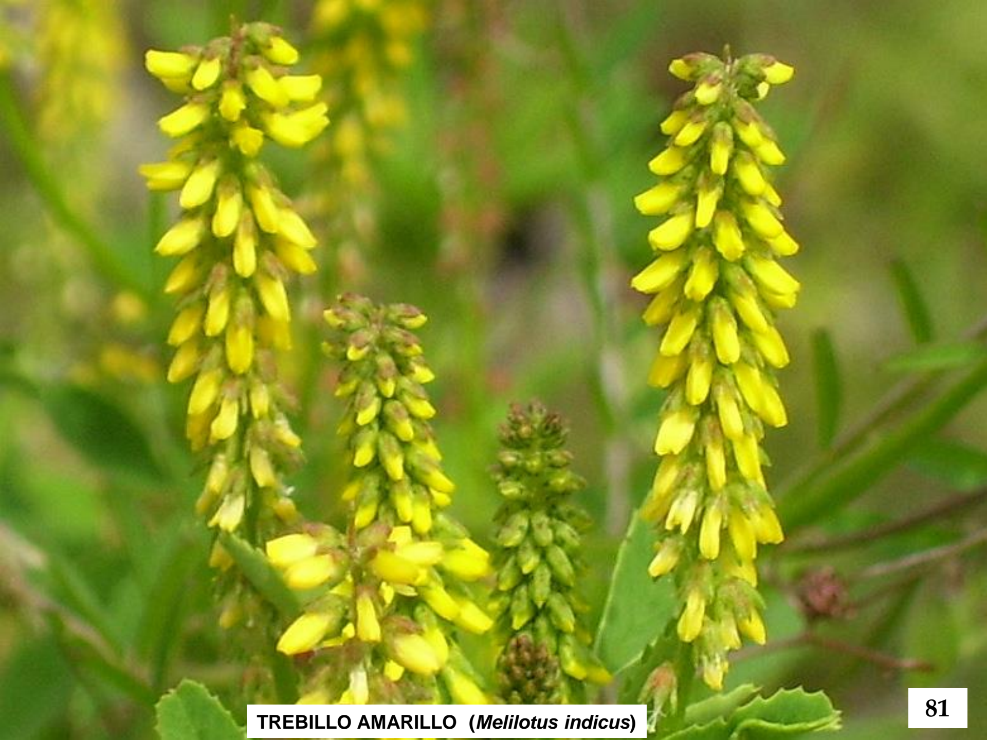
TREBILLO AMARILLO ( Melilotus indicus )