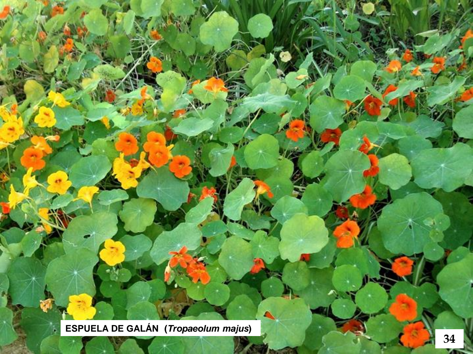
ESPUELA DE GALÁN ( Tropaeolum majus )