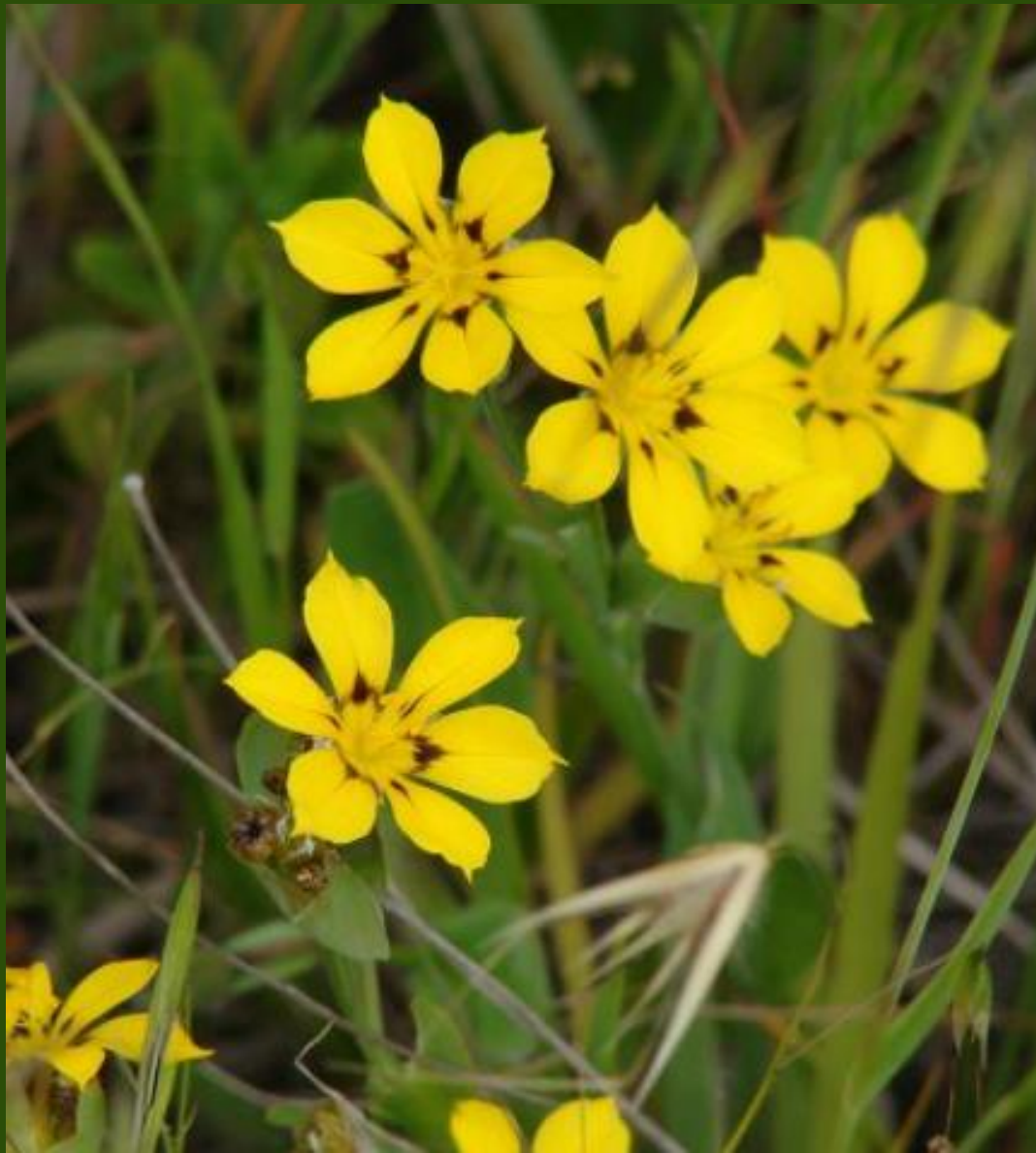
ÑUÑO ( Sisyrinchium graminifolium )