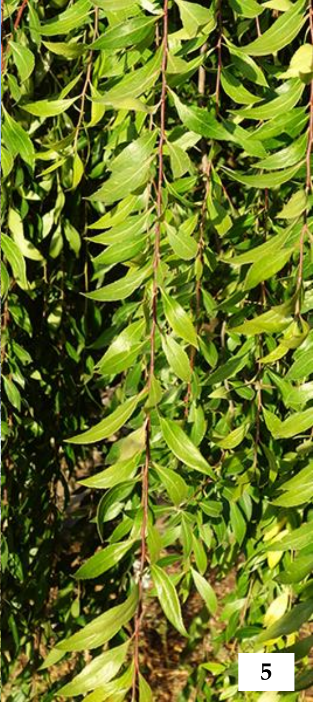
MAITÉN ( Maytenus boaria )