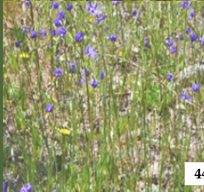
PAJARITO DEL CAMPO, FLOR DE LA VIUDA ( Conanthera bifolia )