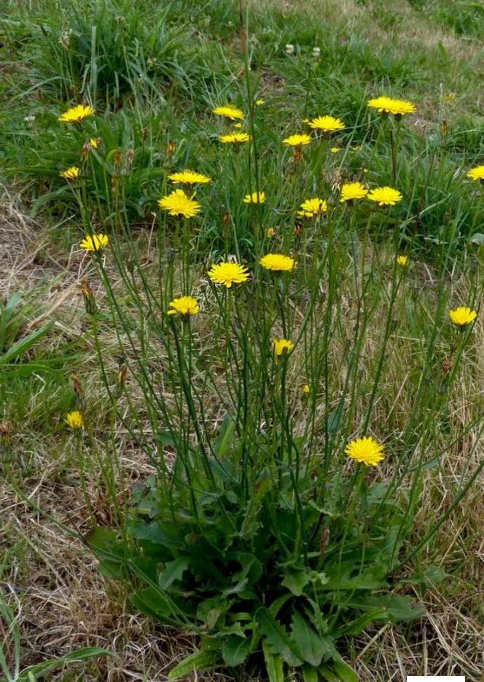
HIERBA DEL CHANCHO ( Hipochoeris radicata )