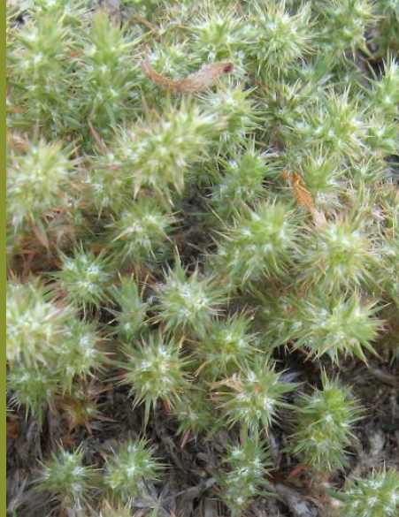
DICHA ( Cardionema ramosissima )