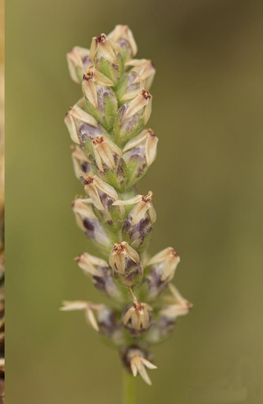
LLANTENCILLO ( Plantago hispidula )