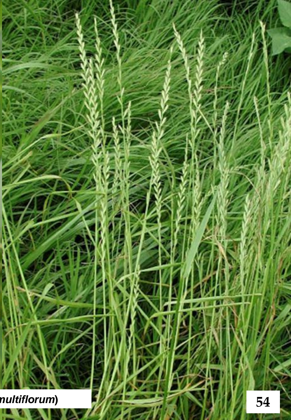
BALLICA ( Lolium multiflorum )