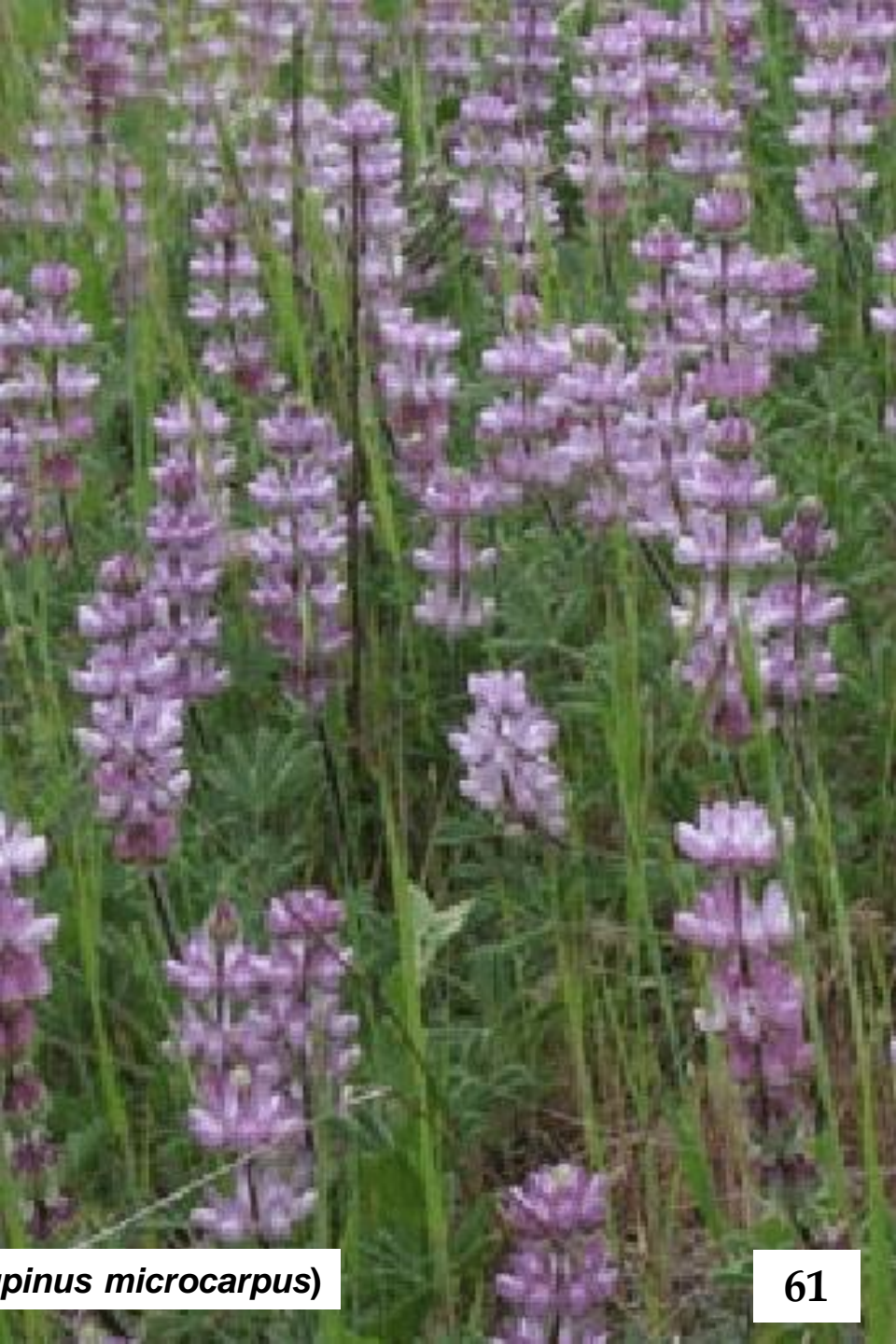
FLOR MORADA ( Lupinus microcarpus )