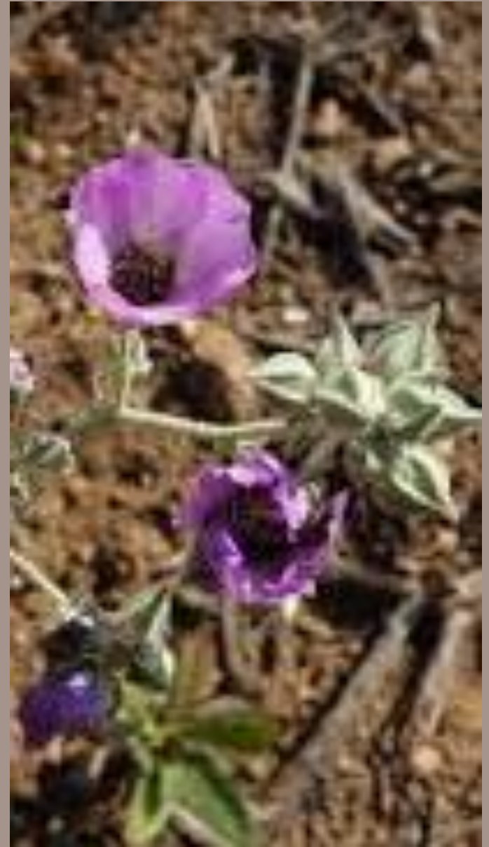
MALVILLA ( Sphaeralcea obtusiloba )