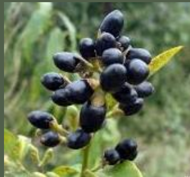
PALQUI ( Cestrum parqui )