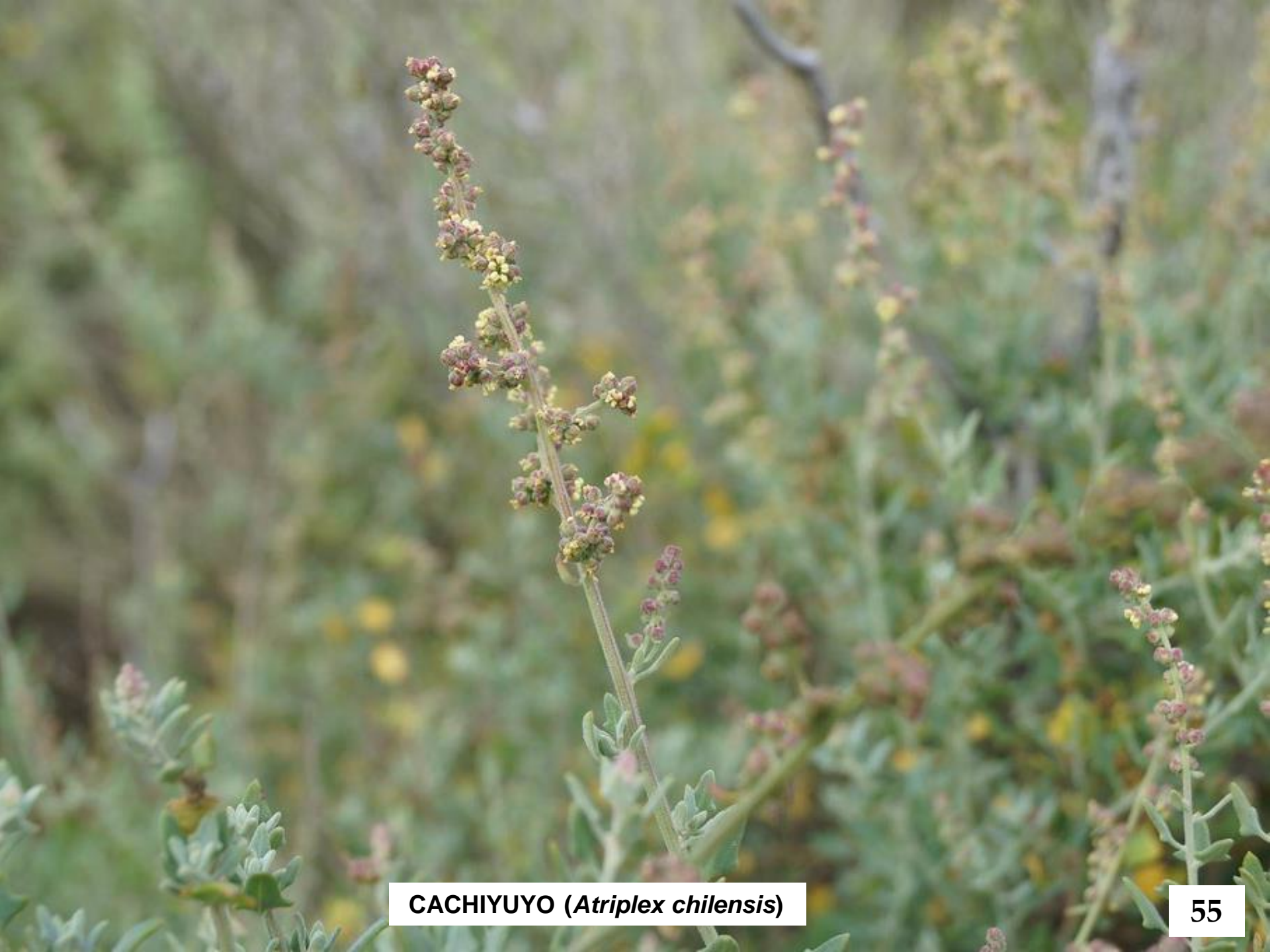
CACHIYUYO ( Atriplex chilensis )