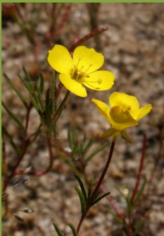
METRÍN ( Camissonia dentata )